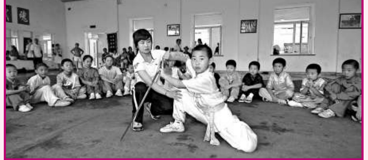
在哈爾濱市兒童少年活動中心舉辦的各種暑期培訓班中，武術培訓深受青少年青睞。圖為教練正在對參加武術培訓的孩子進行劍法指導。