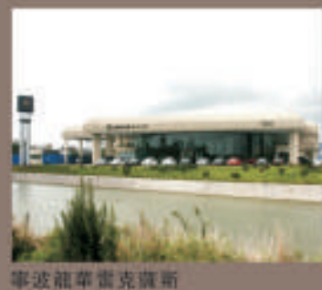
寧波龍華雷克薩斯