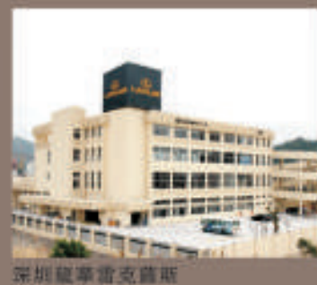
深圳龍華雷克薩斯

廣東省惠州市河南岸和地路21號 (格林豪泰酒店旁) 電話：0752-255 8850 網址：www.hz.lexus.com