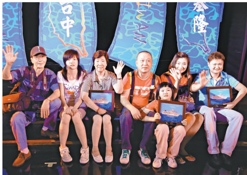
首批八百多名來自北京、上海和廣州等地的內地旅客，對乘坐郵輪赴台旅遊大表興奮，不少人更是首次到台灣

方舜文說，雖然大部分旅客只在港過夜一晚，但根據旅發局以往的紀錄，內地旅客每人的平均消費是五千六百元，相信將會為本港帶來可觀的旅游收益。她期望，有更多郵輪公司以香港作為母港，提供更多不同航程的郵輪旅遊航線，配合香港的郵輪碼頭發展。