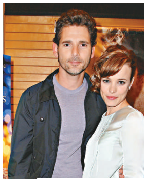
▲麗素 (右) 對艾力讚賞有加

祖迪羅的前妻 Sadie Frost 則力撐前夫，聲言樂意讓三名孩子與祖迪羅的新家庭接觸。