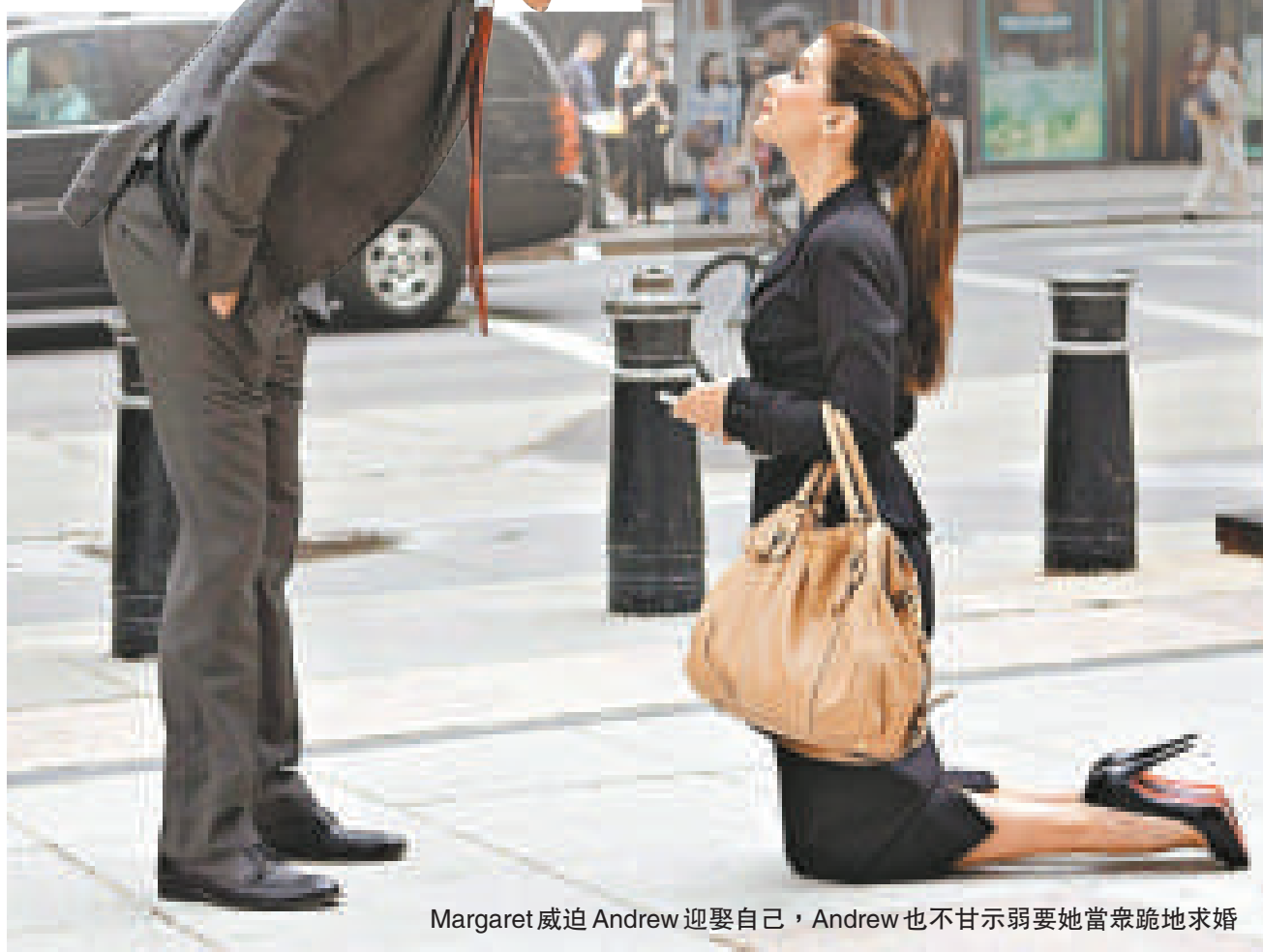
Margaret 威迫 Andrew 迎娶自己，Andrew 也不甘示弱要她當眾跪地求婚