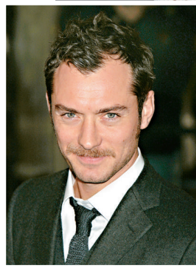
▲祖迪羅將再做老實