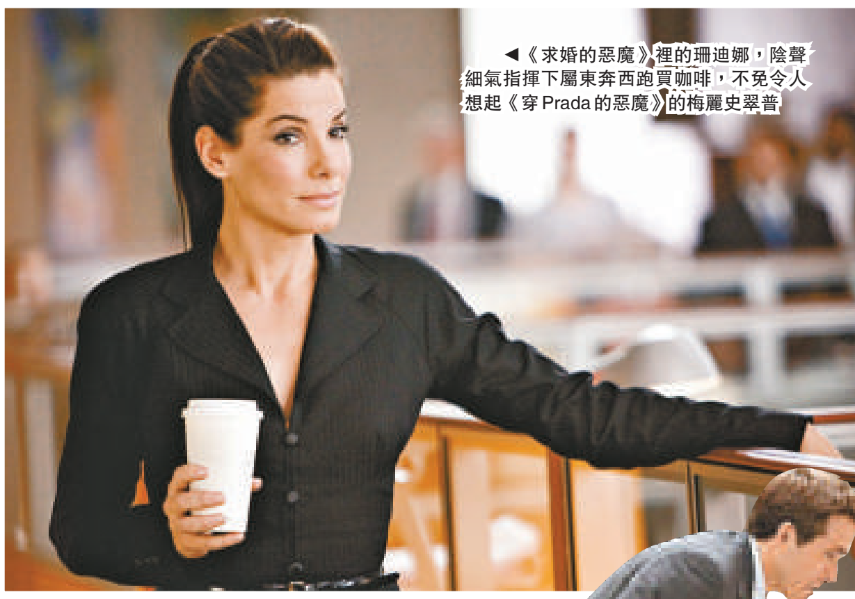
《求婚的惡魔》裡的珊迪娜，陰聲細氣指揮下屬東奔西跑買咖啡，不免令人想起《穿 Prada 的惡魔》的梅麗史翠普

論外表、氣質，有點國字口面的珊迪娜，絕非走甜姐兒路線的材料，憑《生死時速》(Speed) 揚名後，接下來的《暗戀你、暗戀你》(While You Were Sleeping)，珊迪娜飾演終日沉醉在單戀世界的獨居單身女子，明明喜歡某人但至死也鼓不起勇氣跟對方交談半句。而《萬