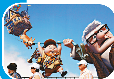
動畫以老少情誼為主軸

於是，七十歲的老頭卡叔成為《冲天救兵》的主角，因為愛妻的離去，成為孤家寡人的他心想，一是等待老死，一是實現與亡妻共同擁有到「仙境瀑布」的美願。於是他把成千上萬的氣球綁在屋頂上，來一招「我欲乘波飛去」的壯舉，誰料殺出了一個胖嘟嘟的「敬老之友」童子軍來，在無計可施下，卡叔唯有帶着他一起上路。托達說，這次的《冲天救兵》除了是一個愛情故事外，亦是一個講成長和知命的童話，同時亦是彼思首次的3D之作。不過，製作人一再強調，3D只是表達技術的手法，絕非他們的賣點，這個當然，彼思的製作技術從沒令人失望過，3D與否實無足掛齒。