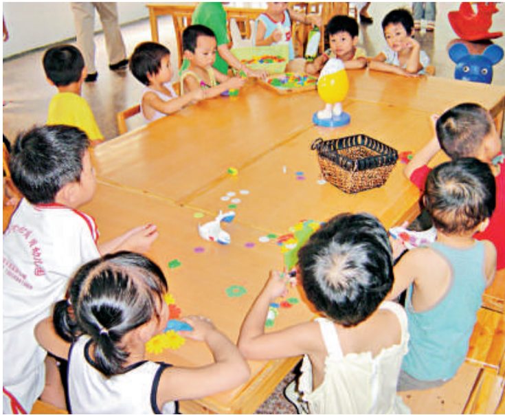
雖然這裡沒有很多遊樂設備，但「小候鳥」們還是感覺很開心