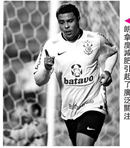
羅拿度減肥引起了廣泛關注

【本報訊】新華社巴西利亞二日消息：「羅馬不是一天建成的」，巴西著名球星羅拿度身上的肥肉也不是一朝養出來的。當年效力於巴西哥連泰斯的那個看上去營養不良的孩子，早已成了3屆世界足球先生，其身體也隨着名氣的增長像吹氣球般般地長，最終被冠以「肥哨」（內地稱為「肥羅」）的稱號。「肥哨」是獨一無二的，雖然體重已讓他無法繼續徵戰歐洲賽場，回國後也曾墮落，巴西報紙雜誌上刊登的，不是其狡黠到入妖的報導，就是遊艇上挺着肚臍的照片。就算是他的簽約巴西豪門哥連泰斯之初，輿論也普遍認為，這只是雙方的一種互相利用。但巴西國內賽場畢竟沒有歐洲賽場的競爭那麼慘烈，羅拿度「優秀青年」的形象又回來了：連續數場比賽進球，率領剛剛重返巴甲的哥連泰斯隊奪得了聖羅羅冠軍和巴西杯冠軍，就連巴西總統盧拉也稱他是「青年人的典範」。 即使這樣，提起羅拿度，使用「肥哨」這個稱號的頻率仍然比「外星人」要高，可見其身體依然雄壯。在全國聯賽開始之初，「肥哨」在有幾場比賽中有些沉寂，不少人又出來質疑其體重問題，球會方面給出的回答仍然是「一切盡在控制中」。最近的幾場比賽，「肥哨」又開始發威，連續進球。正在形勢一片大好的時候，他受傷了，好在受傷的不是那讓他離開賽場一年的膝蓋，而是手。但即使是手受傷了也要休息和治療。 醫生辯稱脂肪屬基因性 在其治療期間，當地媒體又爆出了「肥哨」利用住院順便做抽脂手術的消息。雖然哥連泰斯球會沒有承認抽脂手術一事，但是為羅拿度進行左手手術的醫院透露，從他體中抽出的脂肪有兩大杯，大約700毫升。在聖羅羅營業的整形醫生斯托謝羅說，抽出的脂肪量在巴西法律規定的範圍之內。根據巴西法令規定，一般允許抽出體內脂肪重量應不超過其體重的4%，像羅拿度就最多能抽4公斤。但據說，「肥哨」手術後體重只減少了2公斤。 醫生還透露，抽脂手術之後會有幾天感到疼痛，但是2周後就可以正常參加訓練了。斯托謝羅醫生還特別解釋說，羅拿度體內的脂肪不是用運動的方式就能夠減掉的，而是基因性的脂肪，因此抽出來才能消失。醫院方面透露得如此詳細，球會方面只好以尊重私隱為由，沒有評價這件事。 畢竟是3屆世界足球先生，「肥哨」的一舉一動還是受到關注的。脂肪抽了又如何？就算體重減輕2公斤，應該還是無法改變「肥哨」這個稱號，但大家還是希望他在場上的身形能夠更加輕盈些。哥連泰斯的守門員費利佩也說：「如果他做了手術，將來在賽場上他將能夠更自如地飛翔。」