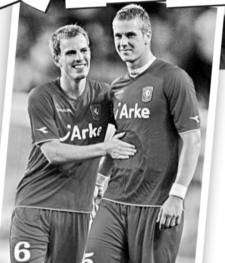
川迪的巴馬(左)和卡