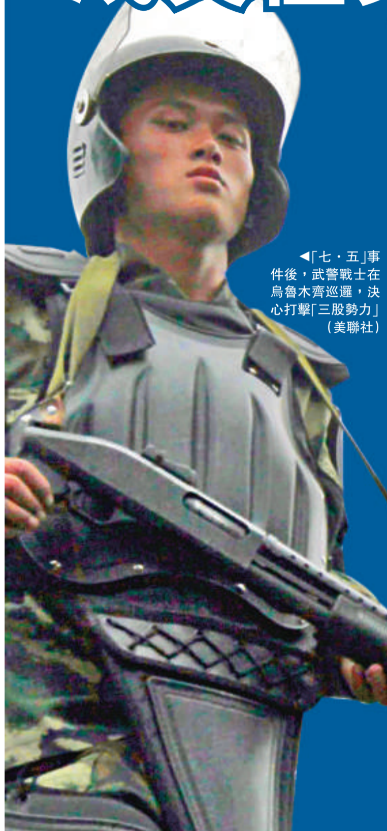
「七·五」事件後，武警戰士在烏魯木齊巡邏，決心打擊「三股勢力」

二日，「突厥斯坦伊斯蘭黨」再次在網上稱，將對世界範圍內的中國利益目標和華人發動襲擊。對此，專家指出，這個恐怖組織是由「東伊運」和「烏伊運」兩大恐怖組織部分成員組成的，人數僅有數十人，他們沒有能力對中國的全球利益目標發動襲擊，但南亞、中亞、土耳其是其活動範圍，仍需防範。 【本報記者楊清林北京三日電】