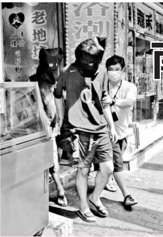
▲淫窟主持被押走 ▶涉賣淫女子帶署