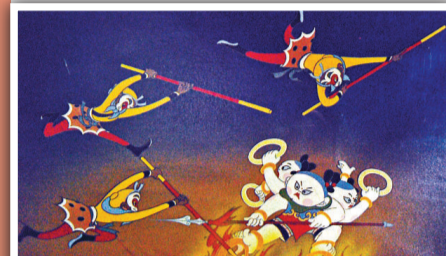
《大鬧天宮》的高度至今難以超越