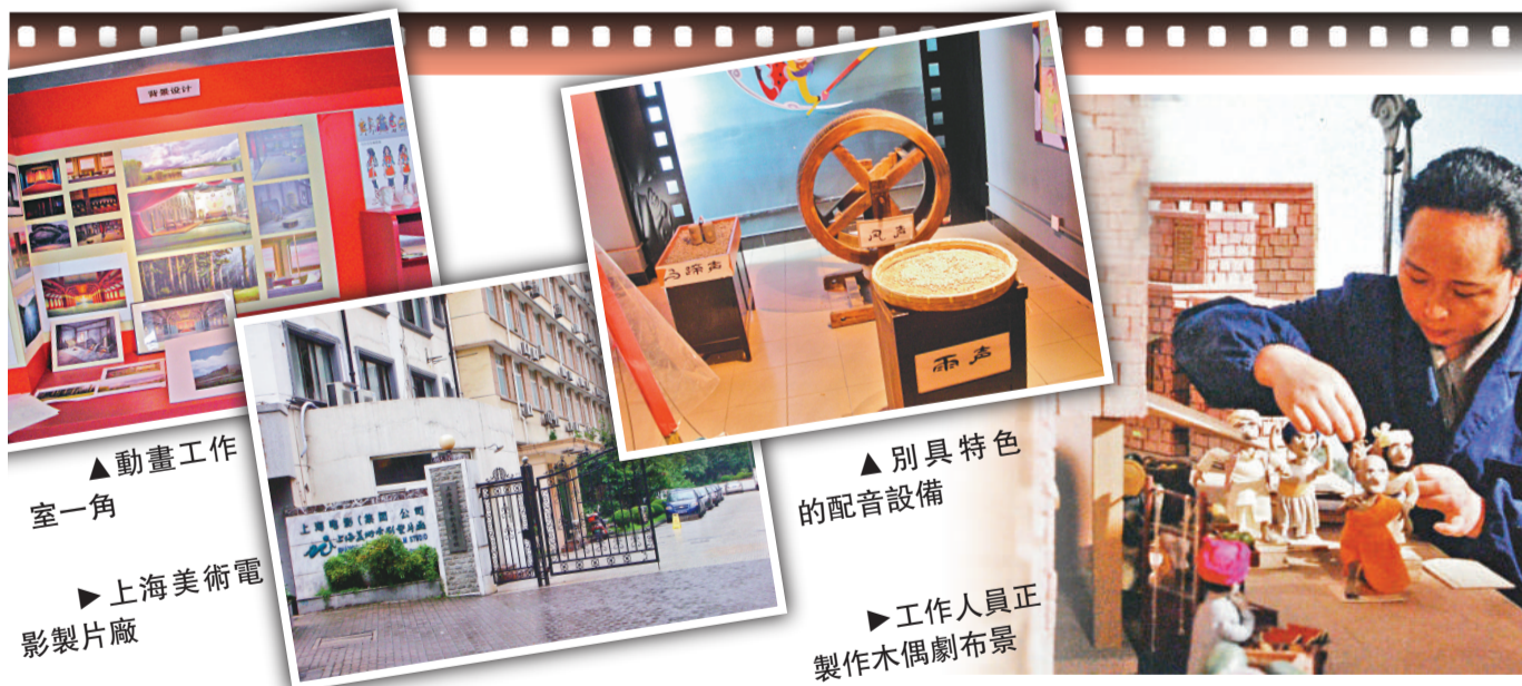
▲ 動畫工作室一角 ▲ 上海美術電影製片廠

據悉，已有香港公司購買了《馬蘭花》的版權。相信不久，這朵「世紀之花」有望與香港觀眾見面。在看慣了商業元素充斥的海外大片之餘，看一看中國特色的情和景，或許別有風味。