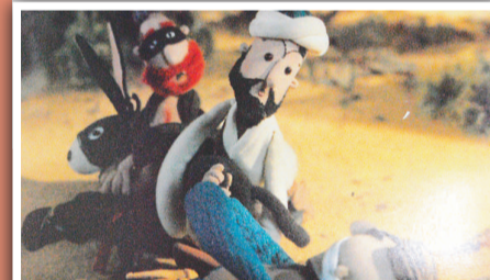
阿凡提體現了勞動人民的智慧