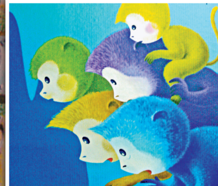
《猴子撈月》採用的拉毛技術現在被運用於國禮製作上