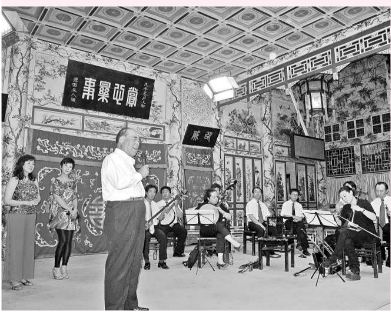
▲郝柏村在恭王府演唱「空城計」