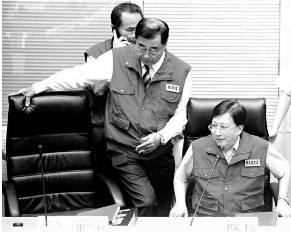
儘管莫拉克颶風來勢洶洶，台灣各地停市，但「行政院長」劉兆玄（右）昨日發表「人民幣納入外匯存底」之說，讓台島各界極為震撼

儘管劉兆玄及邱正雄都強調，人民幣納入外匯存底是未來一個考慮的方向，沒有時間表，但此說在颶風莫拉克正面吹襲台灣、台島各地停市停學之際，仍然備受各方關