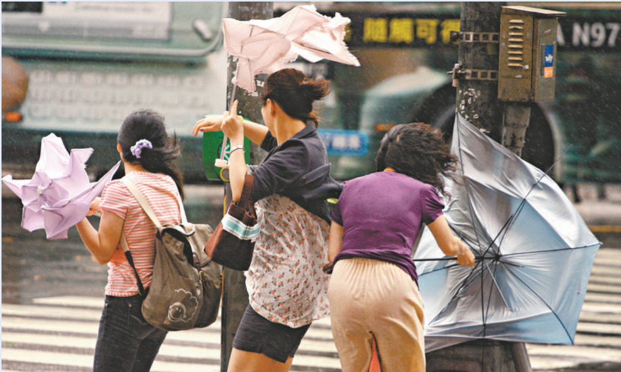
幾位撐着雨傘的民衆遭遇強風，狼狽不堪。