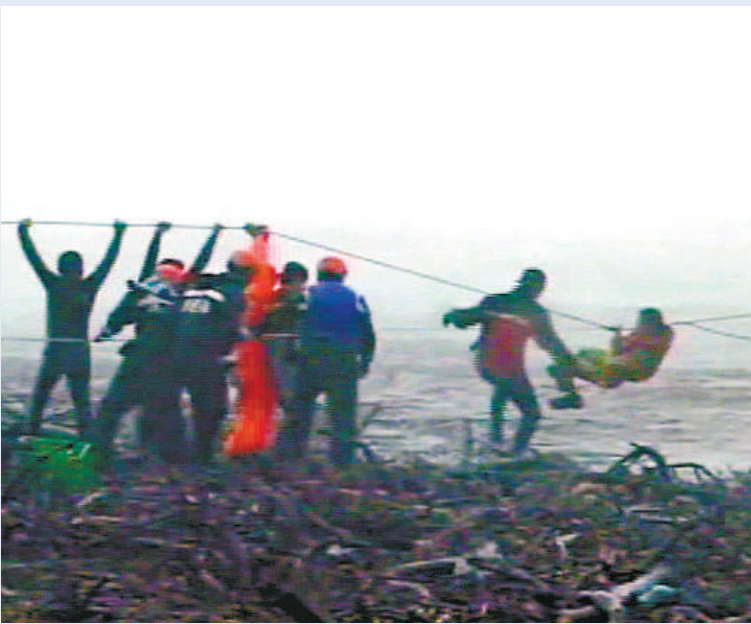
◀▲東埔寨籍兩艘工作船七日擱淺屏東海域，擱淺枋山海域編號NO.1工作船，船上十名船員獲救，擱淺車城海域編號NO.2工作船，至晚間仍在援救船員。