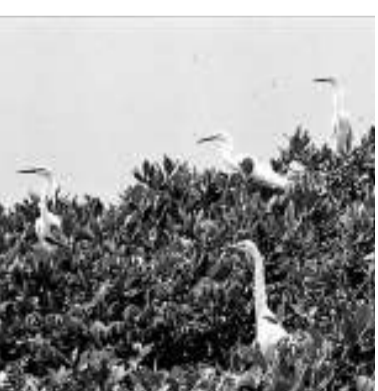
福建漳江口紅樹林保護區成為全球候鳥的繁殖地。

漳江口保護區已經成為鳥類的天堂，主要鳥類有小杓鵲、小青腳鵝、黃嘴白鶯和黑嘴鷗等154種，其中屬於國際候鳥保護協定中日、中澳候鳥保護協定種類分別為77種和41種。據測算，每年大約有十幾萬隻候鳥飛臨紅樹林自然保護區。