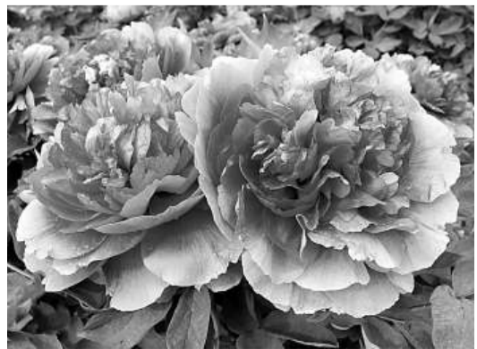
牡丹花保存突破百天，圖為洛陽紅

史國安表示，鮮花保存時間的延長將打破牡丹切花走出國門、走向全世界的重要技術「瓶頸」，將為當地牡丹產業鏈條的延伸與發展壯大起到強有力的推動作用。