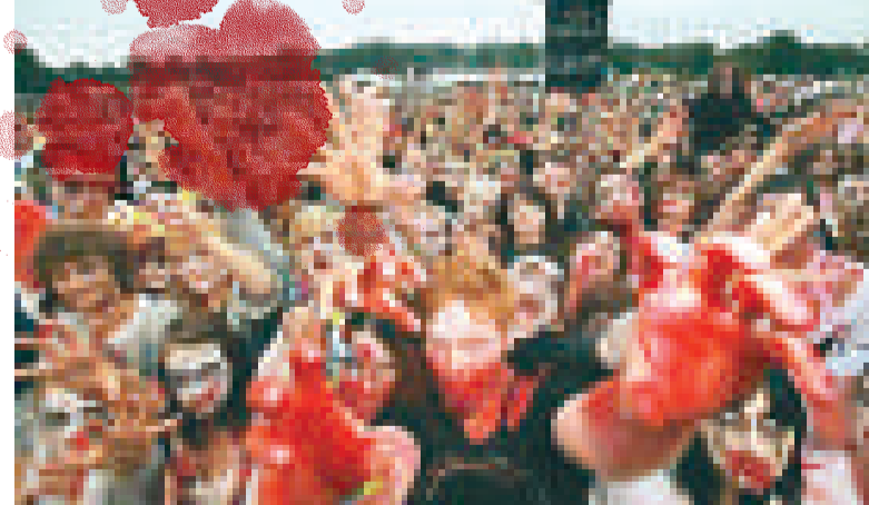
▲英國赫爾福德郡萊德伯里市4026人扮喪屍，刷新了最大規模的喪屍集會世界紀錄

數以千計滿身鮮血，死狀恐怖的喪屍群集英國赫爾福德郡萊德伯里市，刷新最大規模的喪屍集會的世界紀錄。舊記錄是三千八百九十四人，上月在西雅圖創下。