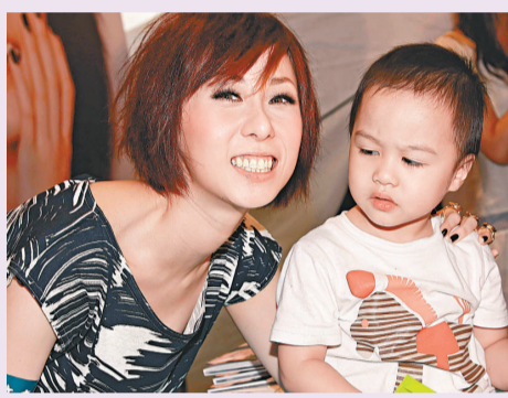
▲泳兒見到這小粉絲，笑得合不攏咀