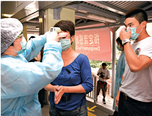
▲八間指定流感診所即將恢復普通科門診服務