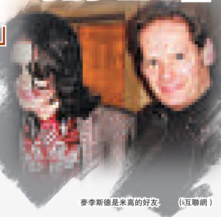
麥李斯德是米高的好友

麥李斯德說，他要把這些事說出來，是因為他擔心自己會被排除在米高孩子們的生活之外。他說：「米高可不這樣。我覺得我必須站出來，正如我所說：『不要排擠我！』」