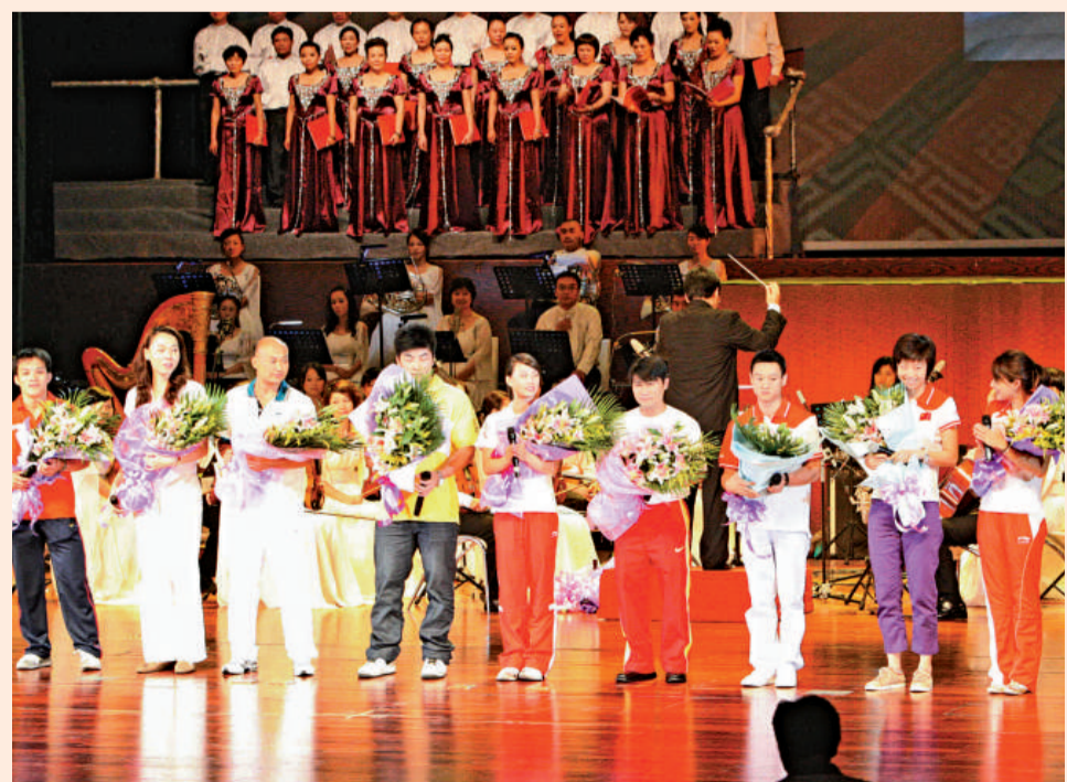
▲奧運冠軍同台共唱《真心英雄》，右起：郭晶晶、張怡寧、楊威

【本報記者張婧媛、劉婧嫻南寧十三日電】首屆廣西體育節明星見面會昨午在廣西南寧舉行。體操奧運冠軍李寧、跳水奧運冠軍郭晶晶、乒乓球奧運冠軍張怡寧、體操奧運冠軍楊威及廣西跳水奧運冠軍李婷等出席了見面會。此次體育節的舉辦旨在弘揚「人人參與，人人健康，人人快樂」的大眾體育精神，激發全民健身的熱情。會上，李寧發表感言