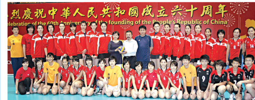
慶祝中華人民共和國成立六十周年