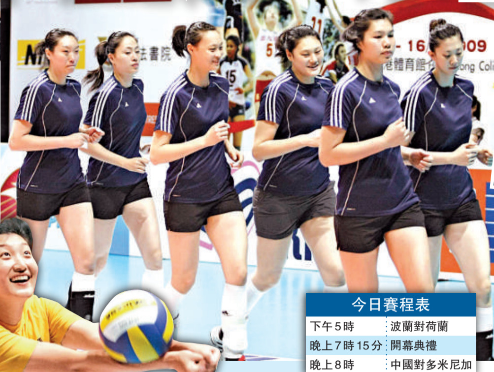
中國女排在操練中進行熱身

多米尼加目前以1勝5負在大獎賽積分榜敬陪末席。球隊於無欲無求下，相信無力抵抗氣勢如虹的中國。今日另一場賽事為下午5時由波蘭對荷蘭。連奪2站冠軍的荷蘭至今6戰全勝，實力在波蘭之上，應有力取勝。今日門票分售400、180、80及30元，60歲或以上高齡/殘疾人士可享9折優惠。賽事目前尚餘少量門票，市民可前往城市電腦售票網各大售票處購買，或致電熱線27349009查詢詳情。