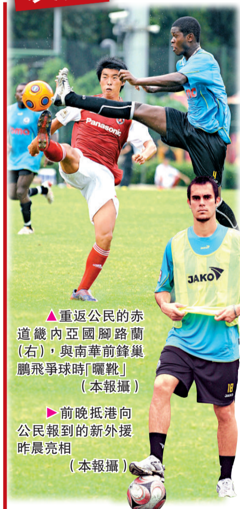
重返公民的赤道畿內亞國腳路蘭(右)，與南華前鋒鵬飛爭球時「曬靴」