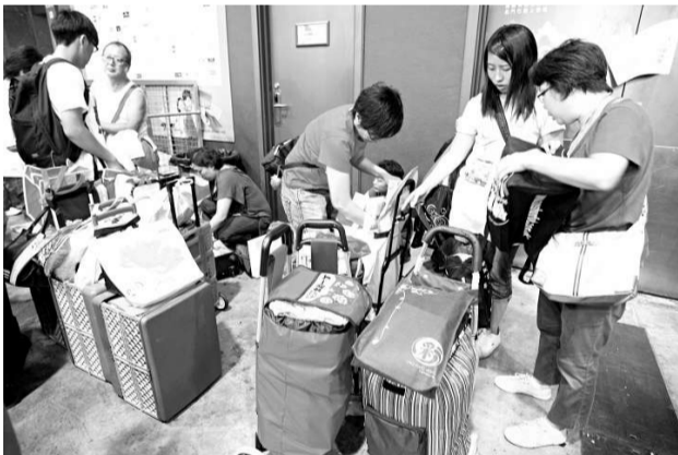
不少參展商藉手推車促銷，吸引大批市民瘋狂掃貨

【本報訊】記者黃雪峰報道：踏入第四日的美食博覽，成為市民周末掃平貨的消費熱點，場內人頭湧湧，售票處更迫滿人龍。有參展商以奇招搶客，藉手推車促銷貨品，吸引大批市民瘋狂掃貨，盛載大包小包的戰利品，一度有逾二百人繞着攤位排隊。