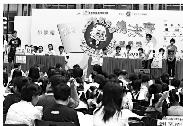
十三支中小學及公開組隊伍，昨日為基本法問答比賽一決高下 (本報攝)

【本報訊】由基本法推介聯席會議主辦的第二屆「《法制先鋒》基本法常識問答比賽」昨日圓滿結束。