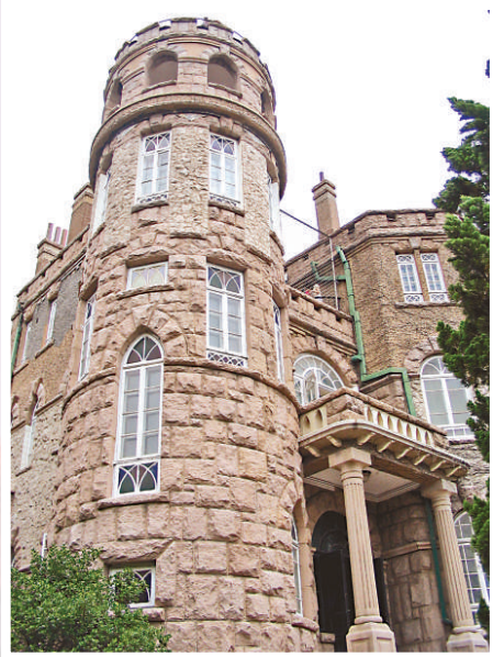
▲八大關的建築揉合二十多個國家的各式建築風格