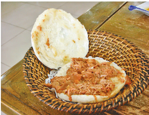
▲臘汁肉夾饃肥而不膩（網上圖片）

「白吉饃」發源於陝西省咸陽市北極鎮，當地自古是陝甘通衢要道，因其驛馬全市白色而得名白驢驛，當地民衆把他們做的發麵燒餅叫作白吉饃。用上好麵粉揉製後做成餅形，置鐵鏊板上略烤成型，放入爐膛側立，上下隔着鐵鏊板的炭火烘烤，稍頃翻面，雙面鬆脆微黃即可出鍋了。好的白吉饃形似「鐵圈虎背菊花心」，外脆裡嫩，夾上臘汁肉同食，那味道真是「撩咧咧！」（陝西話「很好」的意思）