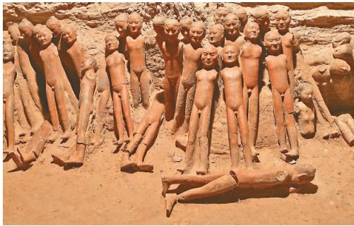
▲在木車旁出土的着衣式陶俑

自駕遊從西安市區出發，可沿北二環入朱宏路，至新建的機場專用高速公路；如從省外入陝直達，可從西安繞城高速公路「朱宏路」出口進入新建的機場專用高速公路。遊客也可以在西安市區內乘坐遊4公交車直達。文物修復參觀項目及模擬考古項目均需提前一周預約，另行收費。