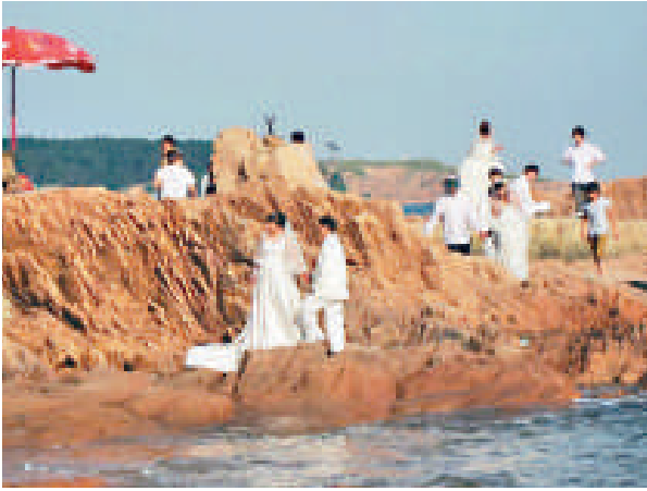
▲青島八大關海邊是很多新人拍攝婚紗照的熱門地點

八大關通過十條道路的連接把公園與庭院結合在一起，形成一個獨特的自然、人文景觀相互融合、相得益彰的特色景區。八大關也被認為是最能體現青島「紅瓦綠樹、碧海藍天」特點的風景區。到青島，必去八大關這是許多青島旅遊的宣傳口號。在青島人的心裡，八大關有着不可替代的地位。一提到青島，人們便會想起八大關。八大關之於青島，就像皇城之於北京，周莊之於蘇州。皇城是京韻，周莊是水鄉，而八大關則是萬國風。有着萬國風遺跡的八大關展開着奧帆之都的翅膀，在文化的旗幟下完完全全的沉醉着，以懷舊的名義痛痛快快的時尚着。