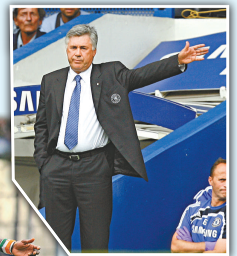
▲車路士主帥安察洛堤期望隊員要精益求精

改善表現，比賽中我們不時犯錯，但球隊重新開始比賽也只不過僅1個月時間，而且目前國際賽不少球員都踢足全場，未達最佳水平也是情有可原。其實今仗並不易踢，尤其是我們先落後，但球員從沒懷疑過自己可以取得入球，這種信念對我們來說非常重要。」