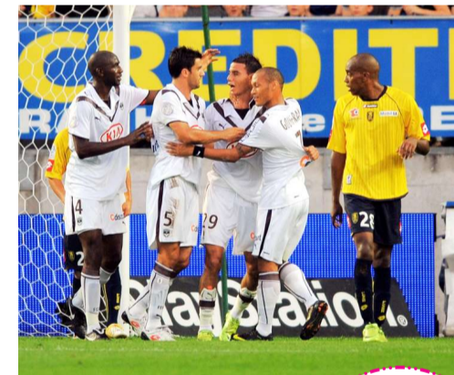
▲波爾多球員慶祝勝利