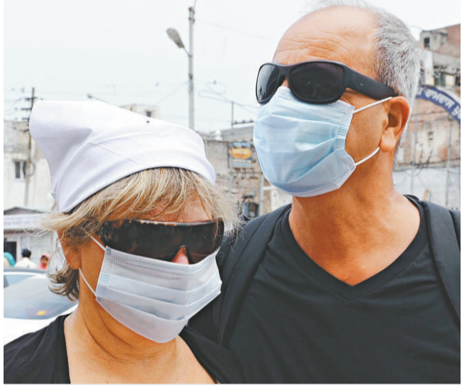
美國遊客十六日在印度戴著口罩遊覽以防範甲流

按照美國一九七六年注射甲型流感疫苗的經驗，最壞情況是每八萬人有一人會出現「吉巴氏綜合症」，每一百六十萬人中有一人會死亡，以全港二百五十萬人接種新疫苗計劃推算，可能有三十一人打針後出現「吉巴氏綜合症」，一人死亡。（本報資料室）