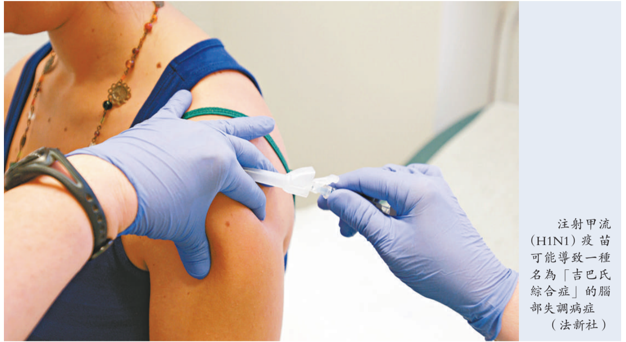
注射甲流（H1N1）疫苗可能導致一種名為「吉巴氏綜合症」的腦部失調病症（法新社）