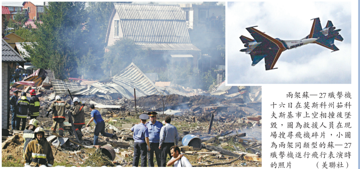
兩架蘇-27殲擊機十六日在莫斯科州茹科夫斯基市上空相撞後墜毀，圖為救援人員在現場搜尋飛機碎片，小圖為兩架同類型的蘇-27殲擊機進行飛行表演時的照片

俄塔社援引俄羅斯緊急情況部中央地區中心的消息說，這架輕型飛機於莫斯科時間十六日十二時五十分（香港時間十六日十六時五十分）在布拉吉諾機場起飛後不久墜毀，機上兩人死亡。事故並未造成地面人員傷亡。