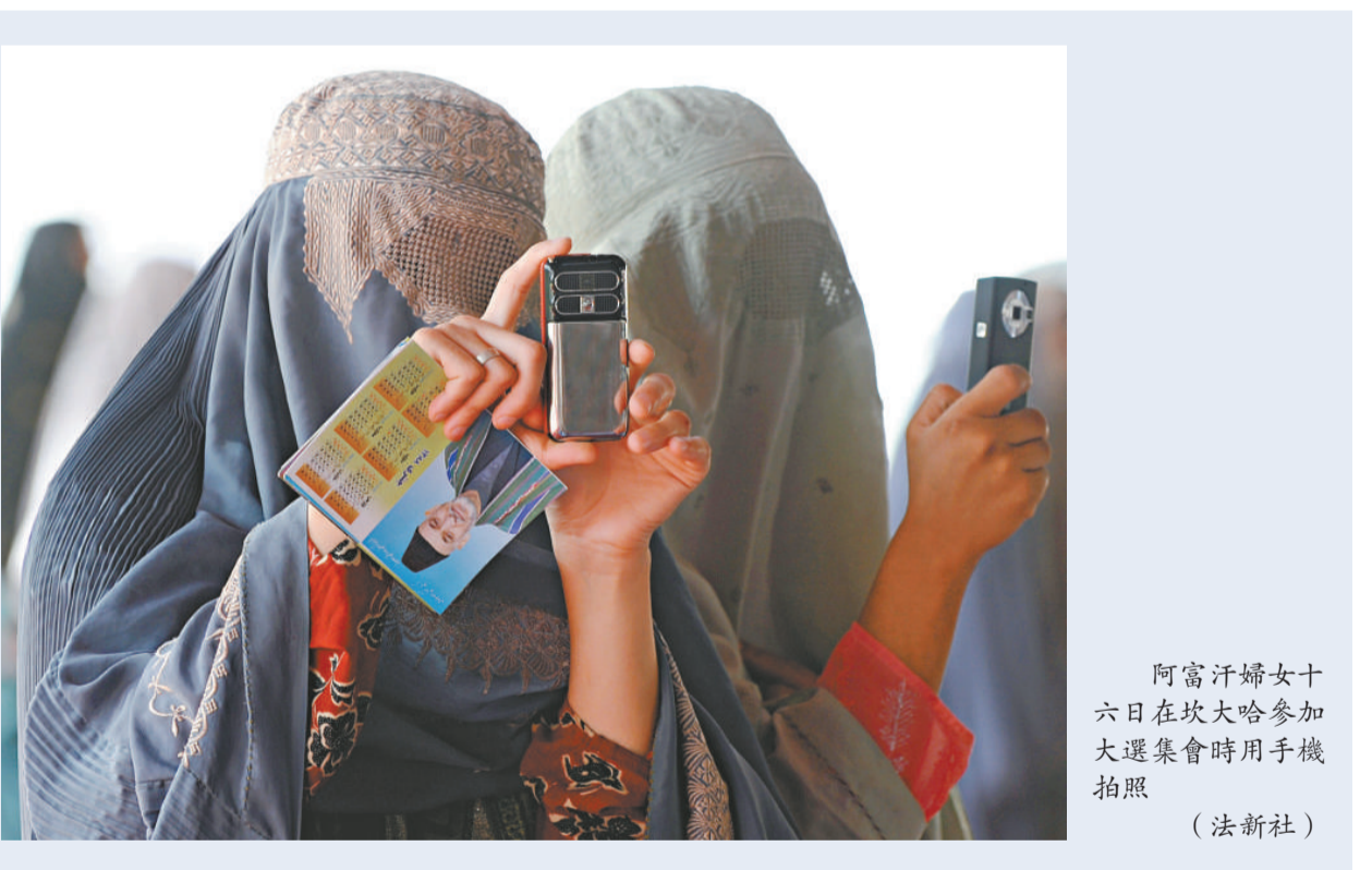
阿富汗婦女十六日在坎大哈參加大選集會時用手机拍照