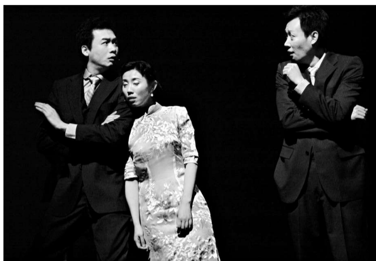
▲男主角振保（兩演員分演同一角色）陷於理智與欲望的掙扎

上海的《新聞午報》認為「導演精心設計的兩個時空中，巧妙地拆分呈現，全面解構了主人公內心最為真實的想法。」《北京晚報》形容「田沁鑫大膽創新張愛玲，道盡了張愛玲意到筆未到的絕望，讓人在笑後感覺悲傷更加徹底。」