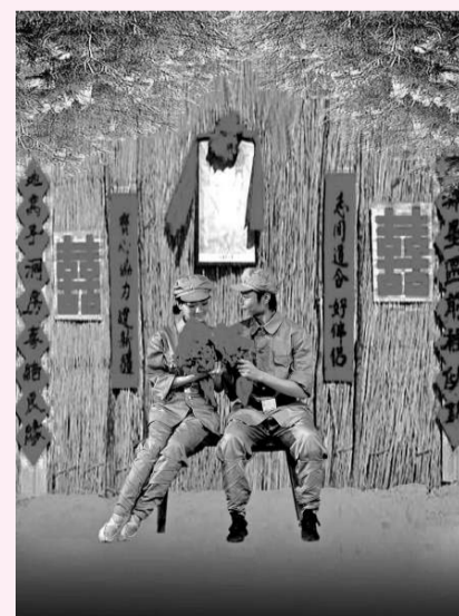
▲湘女和軍人在新疆荒原上組織家庭，開枝散葉

《天山芙蓉》獲選為晉京參加國慶六十周年的獻禮演出劇目，八月十八、十九日在京演出。本報記者 楊斌 通訊員 續東