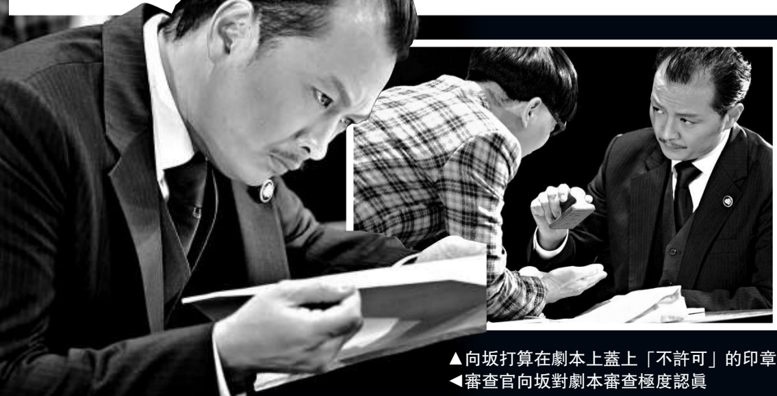
▲向坂打算在劇本上蓋上「不許可」的印章 ▲審查官向坂對劇本審查極度認真