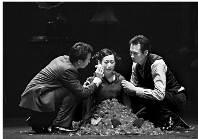
▲《紅》劇還原了張愛玲作品的神髓

《紅》劇在去年成為中國話劇百年的壓軸之作，曾於上海、北京、南京、武漢及深圳等地公演，更贏得各界讚譽