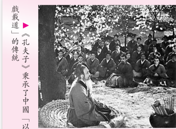
▲《孔子》以「戲載道」的傳統承襲了中國「以

《紅玫瑰與白玫瑰》由康樂及文化事務署主辦，於九月十一至十三日（星期五至日）晚上八時在香港文化中心大劇院公演，屆時將以普通話演出，配以中英文字幕。門票在各城市電腦售票處發售，查詢可電二六八七三二五。