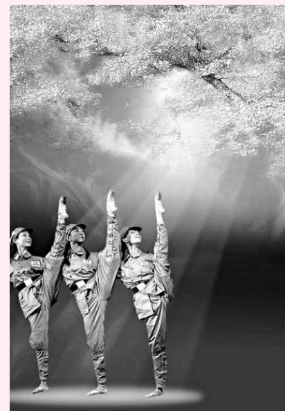
▲《天山芙蓉》反映湖南女青年赴新疆開拓創業的歷史