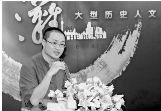
▲《外灘》總導演周兵在發布會上介紹他的創作思路

【本報訊】記者張帆上海報道：知道上海的人不可能不知道外灘。首部關於外灘的大型歷史人文紀錄片《外灘》已完成前期策劃和籌備，並於日前正式開機。該片由上海文廣新聞傳媒集團和中央新聞紀錄電影製片廠聯合出品，並由著名紀錄片導演周兵領銜此前拍攝過紀錄片《故宮》的團隊與上海紀實頻道共同打造。