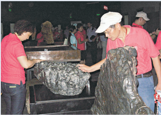
遊人正細心欣賞奇石

花都聚集了來自世界各地的鑽石、黃金、鉑金、白銀、水晶、半寶石、珍珠、瑪瑙、玉石等專業生產企業，種類齊全、工藝成熟，成為華南地區重要的珠寶首飾生產加工基地、原材料集散中心。花都區新華街有關負責人表示，石頭記礦物園象徵着花都珠寶產業從生產加工向文化旅游方向延伸，將以此為契機，進一步挖掘珠寶產業文化內涵，發展具有濃厚地區特色的珠寶旅遊文化產業發展。