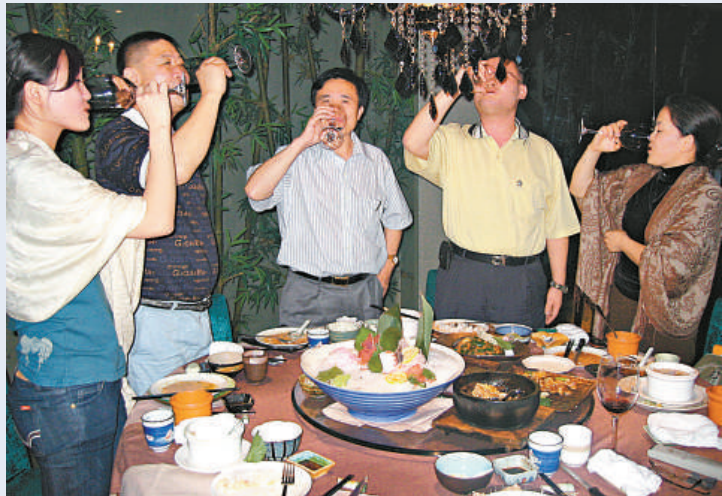
▲酒逢知己千杯少。在中國做生意要先建立「關係」，秘訣之一是參加宴會敬酒時一定要學會說「乾杯」。（本報記者 呂劍攝）

【本報訊】英國《金融時報》曾經這樣形容說，在中國，「關係」是一個迷宮般的網絡，外人很難窺得其中的奧秘，維護這個迷宮需要昂貴的成本，而「酒」是其中一項。如今，愈來愈多的外國人了解中國從北到南，從商場到官場的「酒桌社交」，甚至明白了漢語語境下「關係」一詞的含義。