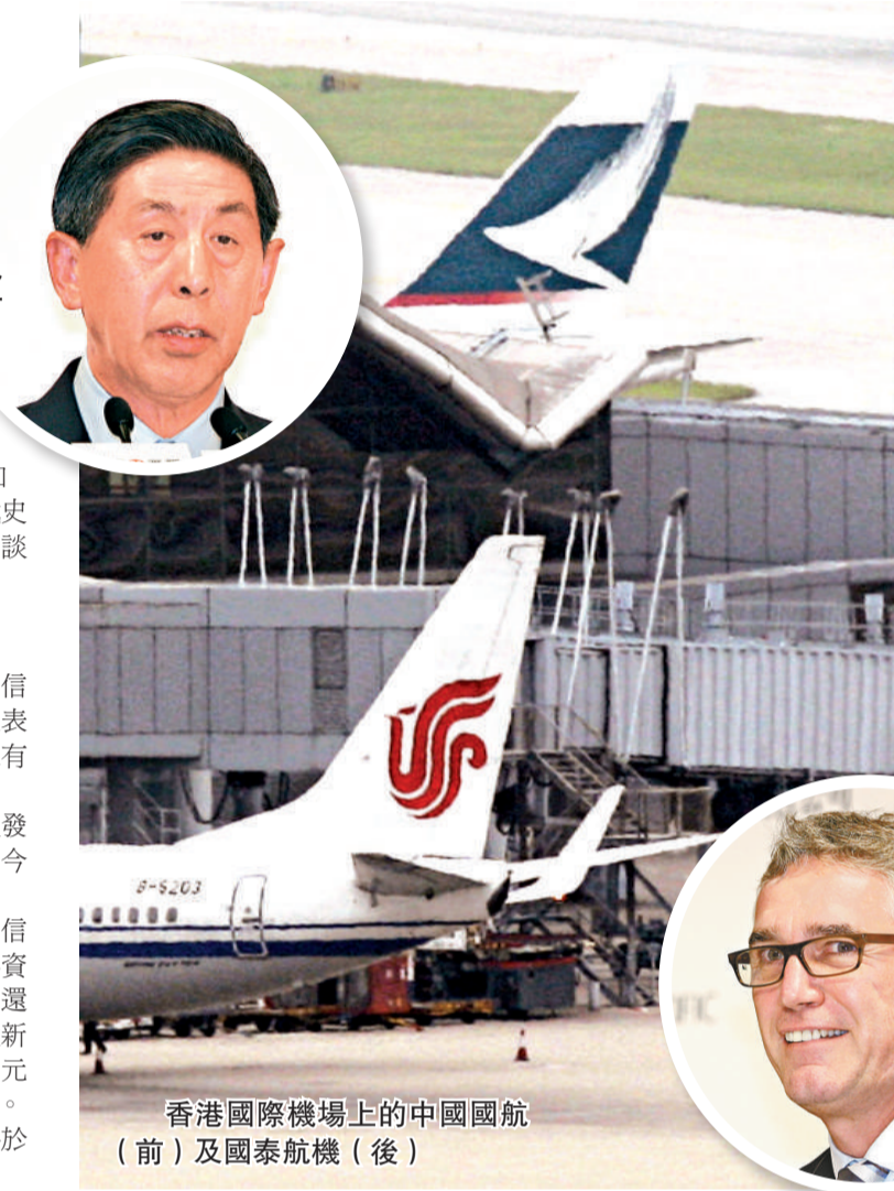
香港國際機場上的中國國航(前)及國泰航機(後)