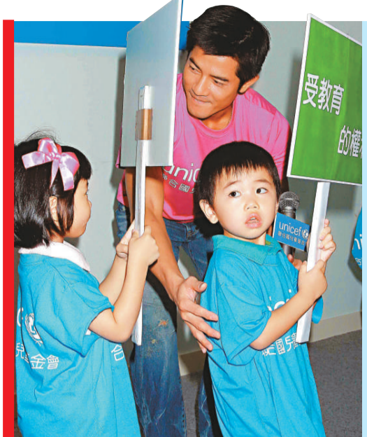
城城出任聯合國兒童基金會香港委員會大使