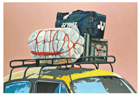
▲《跨越七大洋》(作者：蘇伯德·古普塔)