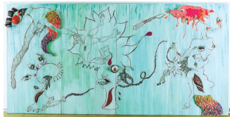
▲《幸運者》(作者：基特·羅·加耐什)