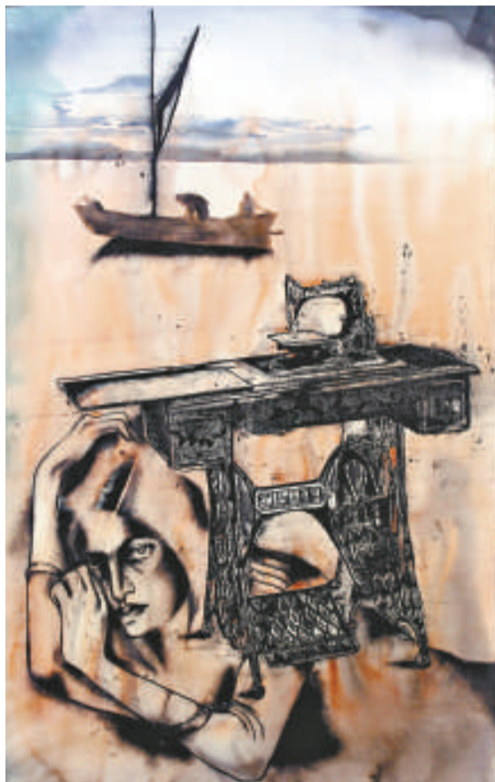
▲《Zindi的肖像》(作者：安居·烏迪婭)