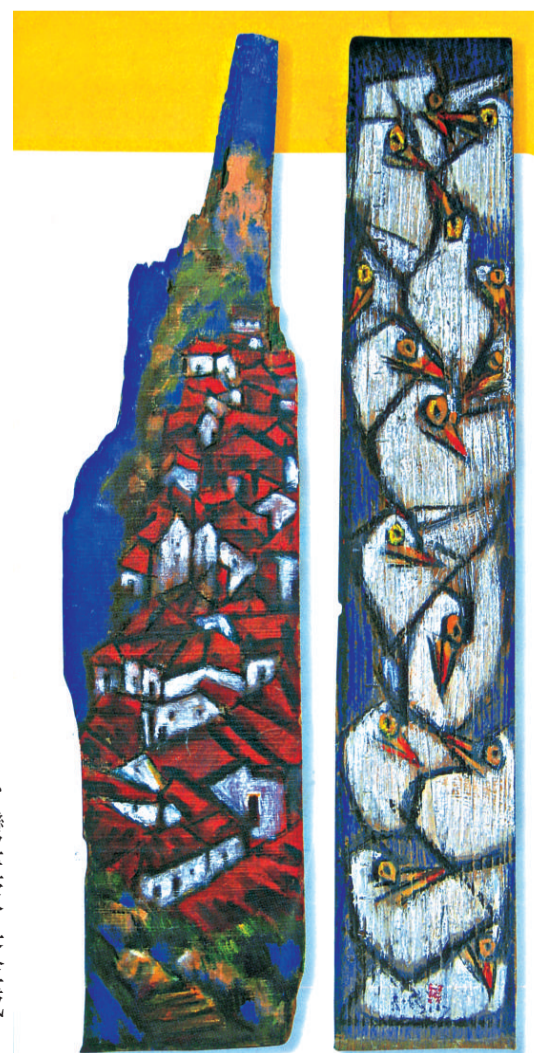
海上桃花源之四（多媒材木板）