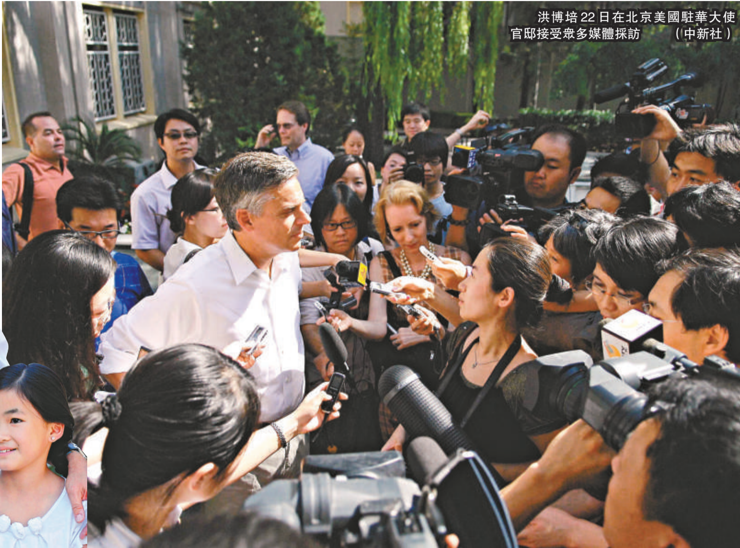
洪博培22日在北京美國駐華大使官邸接受眾多媒體採訪