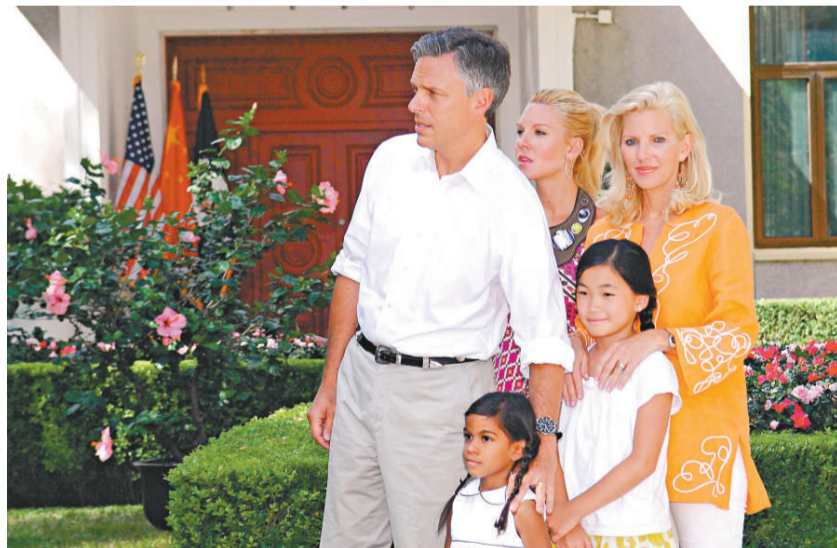
美國新任駐華大使洪博培22日在北京美國大使館新聞處舉行到任媒體會。洪博培發表了履新感言並介紹了自己的家人。圖中前排為洪博培在印度收養的女兒阿莎、中排左一為洪博培、左二為在中國揚州收養的女兒楊樂意、後排左一為大女兒瑪麗安妮、左二為妻子瑪麗凱耶