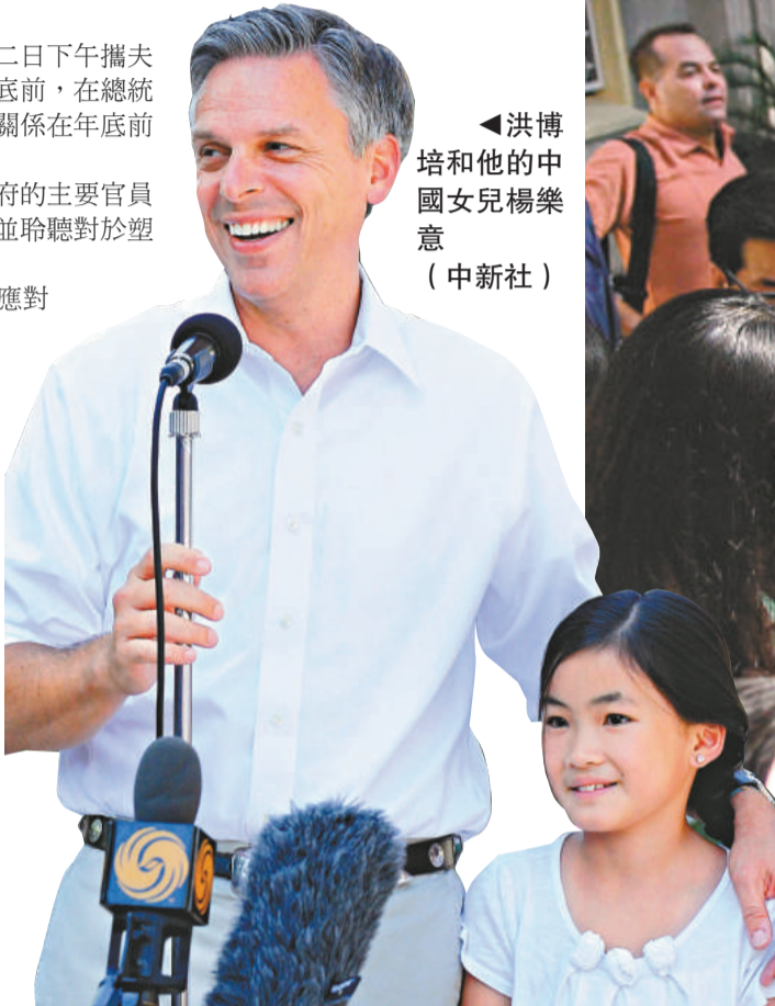
洪博培和他的中國女兒楊樂意

中國大陸研究中美關係的學者認為，新任的大使能不能從前任的經歷中總結經驗，在中美關係的危機階段做出果斷決定，加強同中方的溝通，並且考慮中國民間情緒避免局勢失控，是洪博培將會遇到的挑戰。