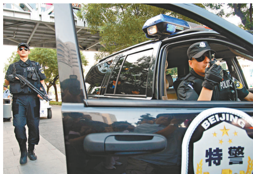
隨著新中國成立六十周年的臨近，北京22日啓動二級巡邏防控工作，整合各類安保力量加強街頭巡邏 (新華社)