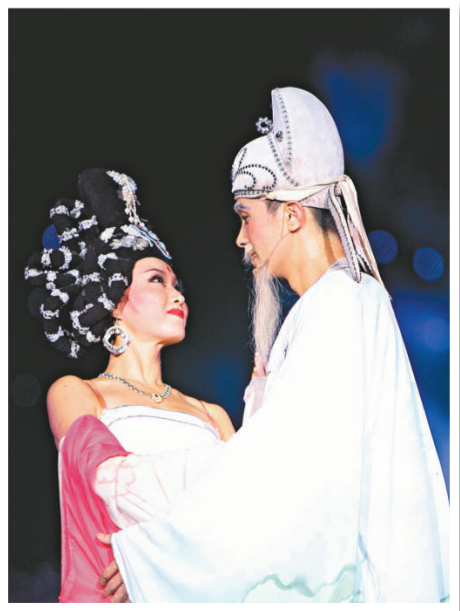
▲《長恨歌》劇照

走出華清池，一種期望隔了時空無法着落，一種願望隔着山水無法釋懷，攪不動九龍湖一湖春水，卻是《長恨歌》婉婉的吟唱：在天願作比翼鳥，在地願為連理枝。次一個「七夕」節，選擇遊覽華清池，為歷史的厚實，更為愛情的柔軟。