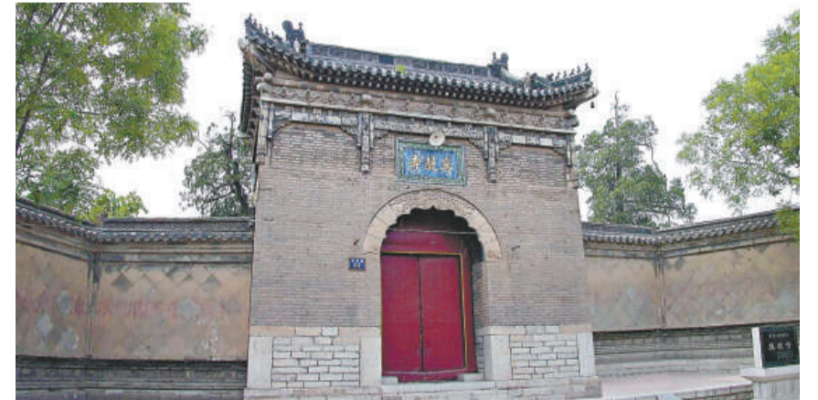
位於昭德古街上的真教寺

走到北關街的北端就是北關子的遺跡，這裡又稱玄帝閣，因上層有玄武大帝的神像而得名。此外，在青龍街東頭還有個東閣子，又名碧霞閣，上層為碧霞祠，建國後成為學校，即現在的青龍回小。另外，昭德街南有昭德閣，東關街口有海岱閣，北關街外有新街閣。