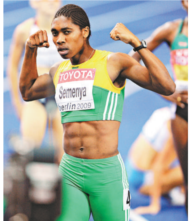
塞門妮奪得女子八百米金牌（資料圖片）

但對塞門妮舉丸素水平的分析是在南非做的。據說，正是南非的測試結果導致國際田徑總會決定要求南非分會對塞門妮進行詳細的「性別核實」測試。