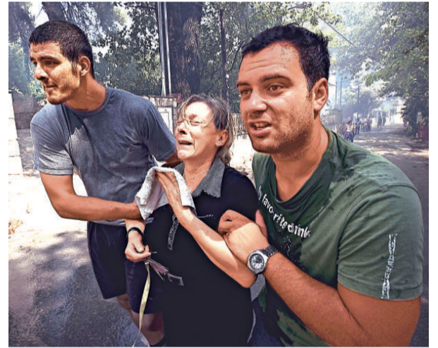
兩名男子二十三日強行帶走不願意離開家園的女子（法新社）

歐盟委員會創立的歐洲森林火災信息系統每天向成員國和歐盟有關機構發布森林火警信息，並評估火災可能造成的影響。為了有效及時地幫助成員國滅火，去年歐洲議會出資三百五十萬歐元，於今年夏天創立了「歐盟滅火飛機戰術儲備」，主要是從空中協助成員國撲滅森林大火。（新華社）