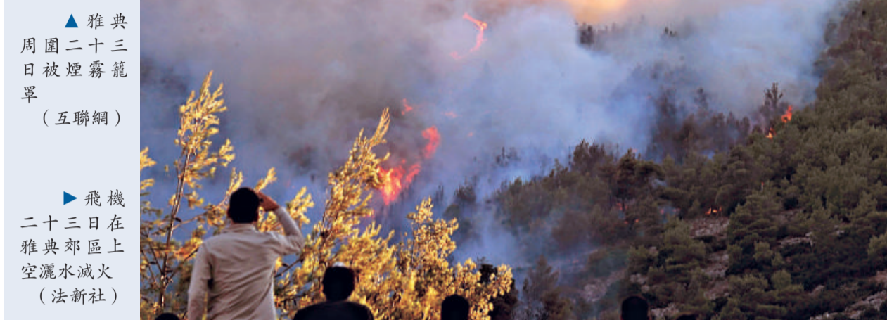
▶ 飛機二十三日在雅典郊區上空灑水滅火