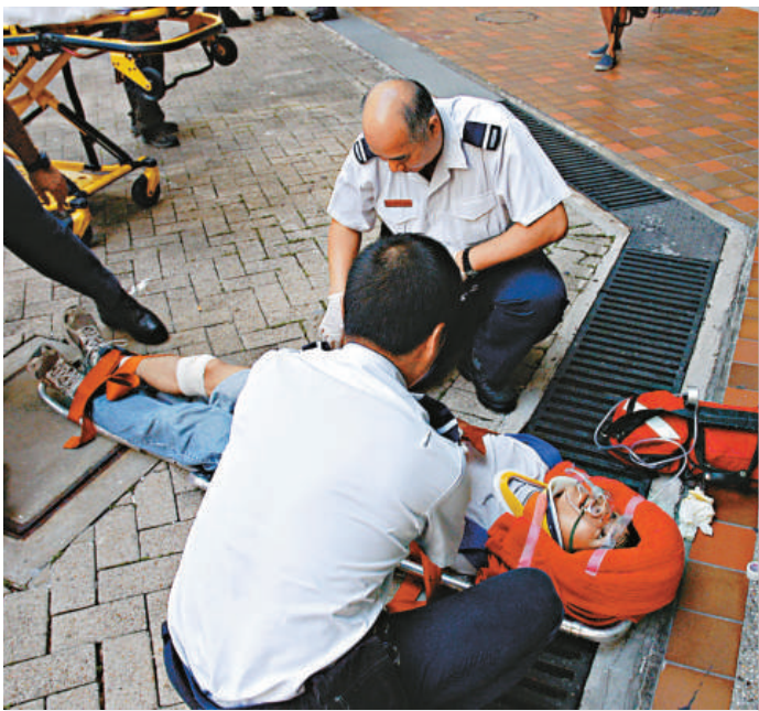
▲救護員為清潔工療傷