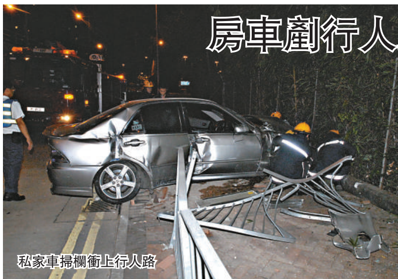
私家車掃欄衝上行人路

【本報訊】一輛私家車昨日凌晨駛至尖沙咀漆咸道南時，疑閃避切線車輛失控，撞毀路旁六米鐵欄後剷上行人路，車身毀爛，司機右手及背部輕傷。