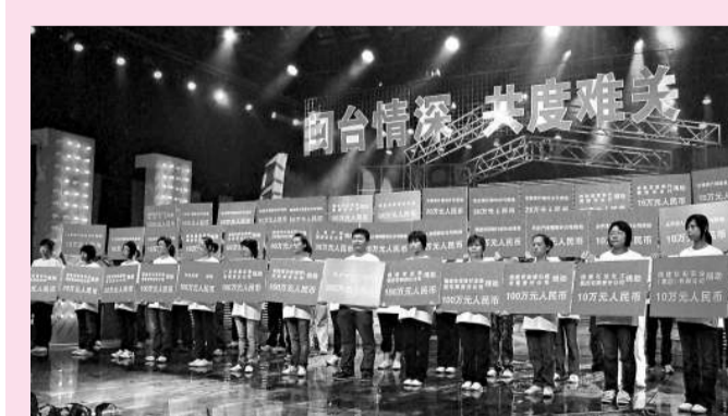
▲「閩台情深 共渡難關」賑災晚會上，閩省各企業單位紛紛慷慨解囊

記者注意到，海西戰略出台以來，在中央的支持下，已經有五十多個部委、中央企業與福建簽署了以各種形式支持海西建設的合作協議或會議紀要，並逐步進入實施階段。莆田市委書記楊根生此前向記者表示，國務院支持海西《意見》發布之後，福建各地都呈現出乘勢而上，競相開放的態勢，爭取吸引更多的央企及世界五百強企業到福建投資。據了解，目前已有多家中央企業到福建考察石化、製造業等。