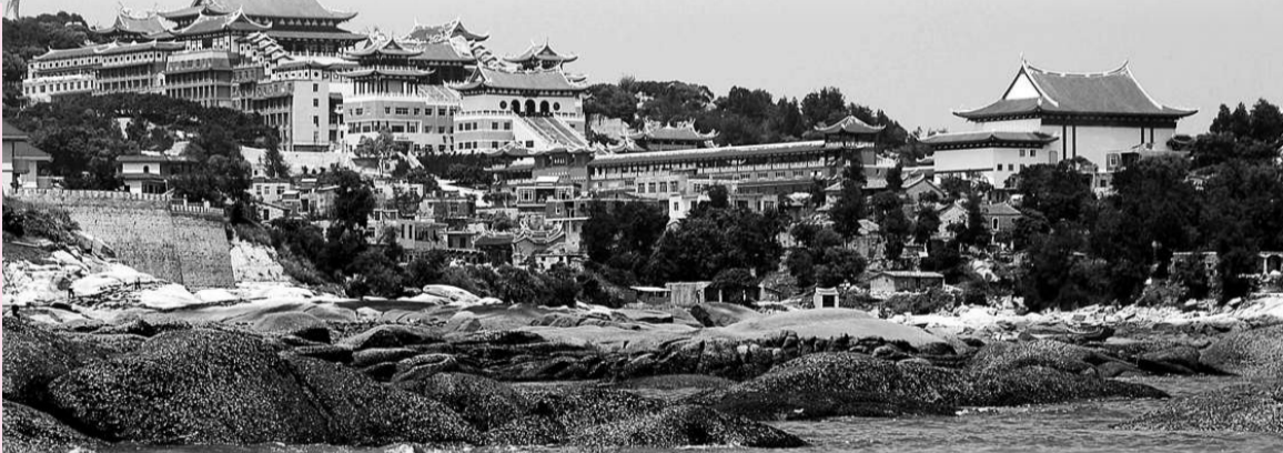
▲風光旖旎的湄洲島是媽祖的故鄉（本報資料） ▲湄洲港位於海西港口群的中心，是距離台灣島最近的港口之一。圖為海西港口群布局（本報資料）