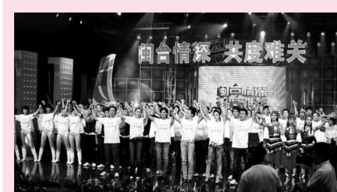
▲「閩台情深 共渡難關」賑災晚會上，眾演職人員手牽手為台灣災區同胞祈福