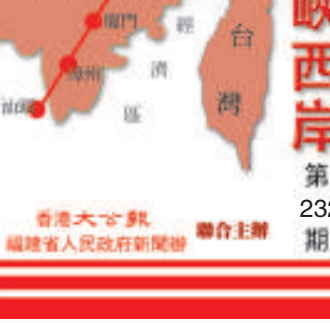
崛起海峽西岸 第 232 期

記者粗略估算，福建各界累計捐款迄今已達一億多元。目前，各地的募捐活動仍在持續。除了募捐，閩省調集的十八噸蔬菜也已由廈門急運金門，用以緩解當地菜荒。