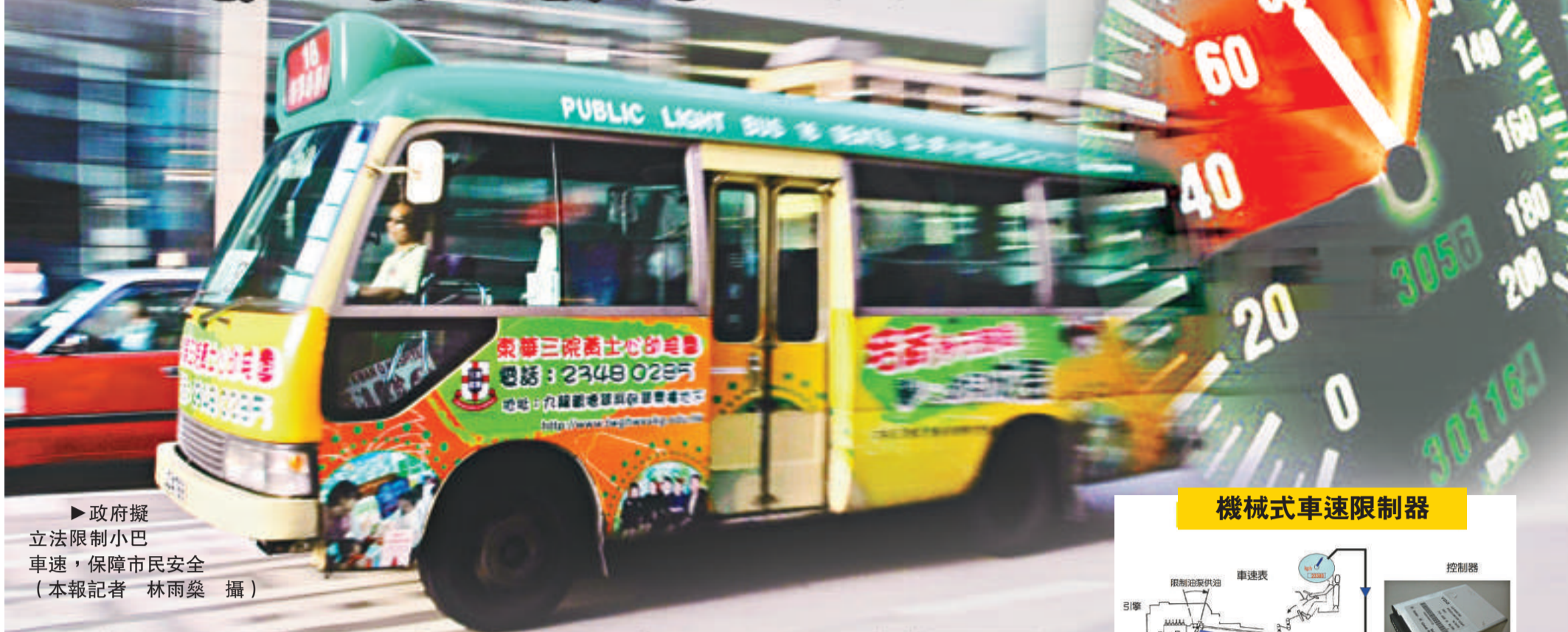
▶政府擬立法限制小巴車速,保障市民安全