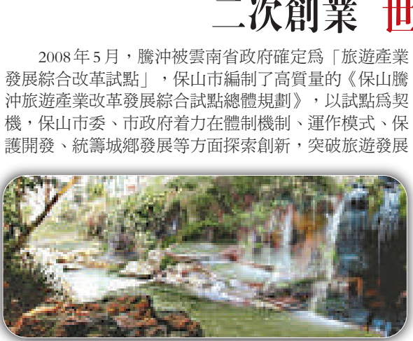
▲邦臘掌河谷位於龍陵縣香柏河谷地帶，溫度適宜，森林茂密，鳥語花香。景區內溫泉密布，泉眼600餘口，密集區日供水水量4000立方米左右，最高水溫104℃