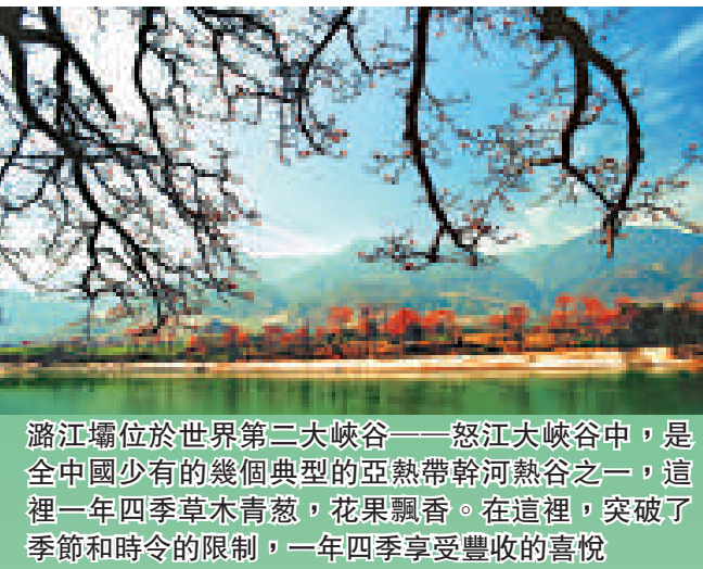
騰江壩位於世界第二大峽谷——怒江大峽谷中，是全中國少有的幾個典型的亞熱帶乾熱谷之一，這裡一年四季草木青蔥，花果飄香。在這裡，突破了季節和時令的限制，一年四季享受豐收的喜悅