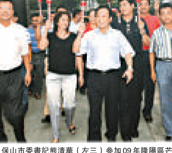
保山市委書記熊清華（左三）參加09年隆陽區芒寬鄉火把節

熊清華表示保山建成國際知名旅遊目的地，打造為宜居、宜旅、宜業及充滿生機活力的旅遊區指日可待。目前在強化境外旅遊的業務管理的同時，保山大力開發新興旅遊產品，推動旅遊產品由單一的觀光型產品向觀光休閒度假康體型產品的轉變，以此提升具有保山特色的旅遊品牌。