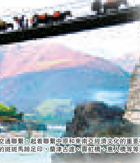
南絲路惠機：保山內外通達的交通聯繫，起着聯繫中原和東南亞經濟文化的重要樞紐作用。現今，南方絲綢古道上的斑斑馬蹄足印，蘭津古渡、寶虹橋、惠人橋等等遺存，都銘刻着歷史的印跡