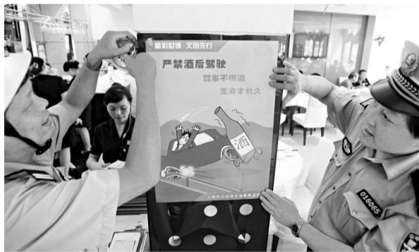
二十四日，上海黃浦交警在酒店、酒吧等餐飲區域開展「駕車不喝酒、生命才長久」宣傳活動，並現場為食客實施「體驗式酒精測試」，提醒駕駛員酒後不駕車

幾乎所有受訪的家庭主婦都表示「嚴查好」，希望警方繼續保持目前的高壓態勢，讓自己的丈夫、親屬開車出門更「老實」，讓「家裡的人」多點放心、少點擔驚受怕。