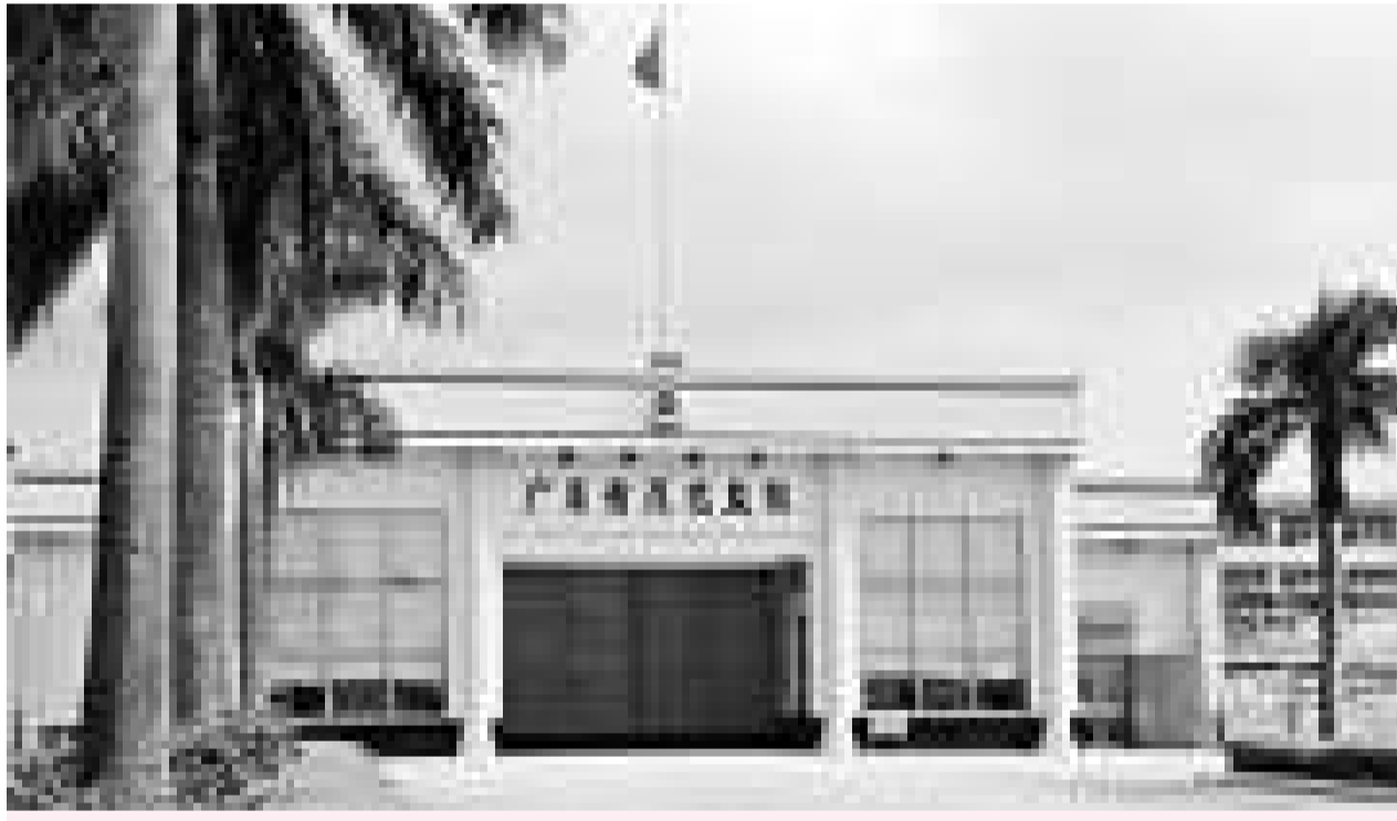
茂名監獄黑幕致多名官員落馬

帖稱，伙房、醫院以及集訓這三大監區是犯人最為嚮往的地方，犯人要想在這3個監區服刑，交錢價格分別是：集訓監區4000元~8000元；醫院與伙房兩個監區8000元~12000元。而在每個生產監區，做工之外，犯人有不同的