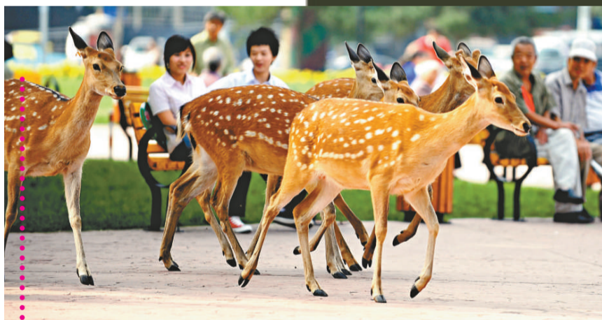
草原鋼城內蒙古包頭市積極發展城市公園、廣場綠地建設，先後建成了銀河廣場、如意廣場、兵器廣場、阿爾丁植物園等數十個特色廣場公園。上圖為包頭市銀河廣場幾頭梅花鹿從人群中走過。 下圖為阿爾丁植物園