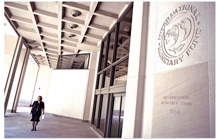
總部設在華盛頓的IMF，在今次金融危機之中再度扮演「救火隊長」角色

全球經濟開始復蘇，熱錢流入金融市場，諾貝爾經濟學獎得主施蒂格利茨接受訪問說，大量熱錢流入亞洲，可能造成資產泡