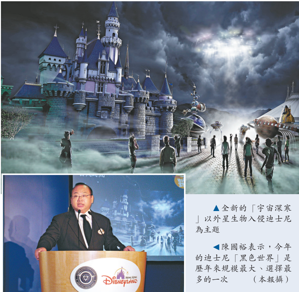
▲全新的「宇宙深寒」以外星生物入侵迪士尼為主題