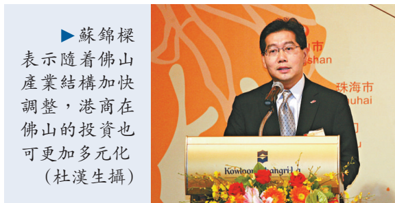
►蘇錦樑表示隨着佛山產業結構加快調整，港商在佛山的投資也可更加多元化

【本報訊】商務及經濟發展局副局長蘇錦樑昨日出席「佛山—香港CEPA合作交流會」時公布，截至今年六月，佛山批准設立的港資企業累計超過六千家，港商已成為佛山市最主要的外商之一。