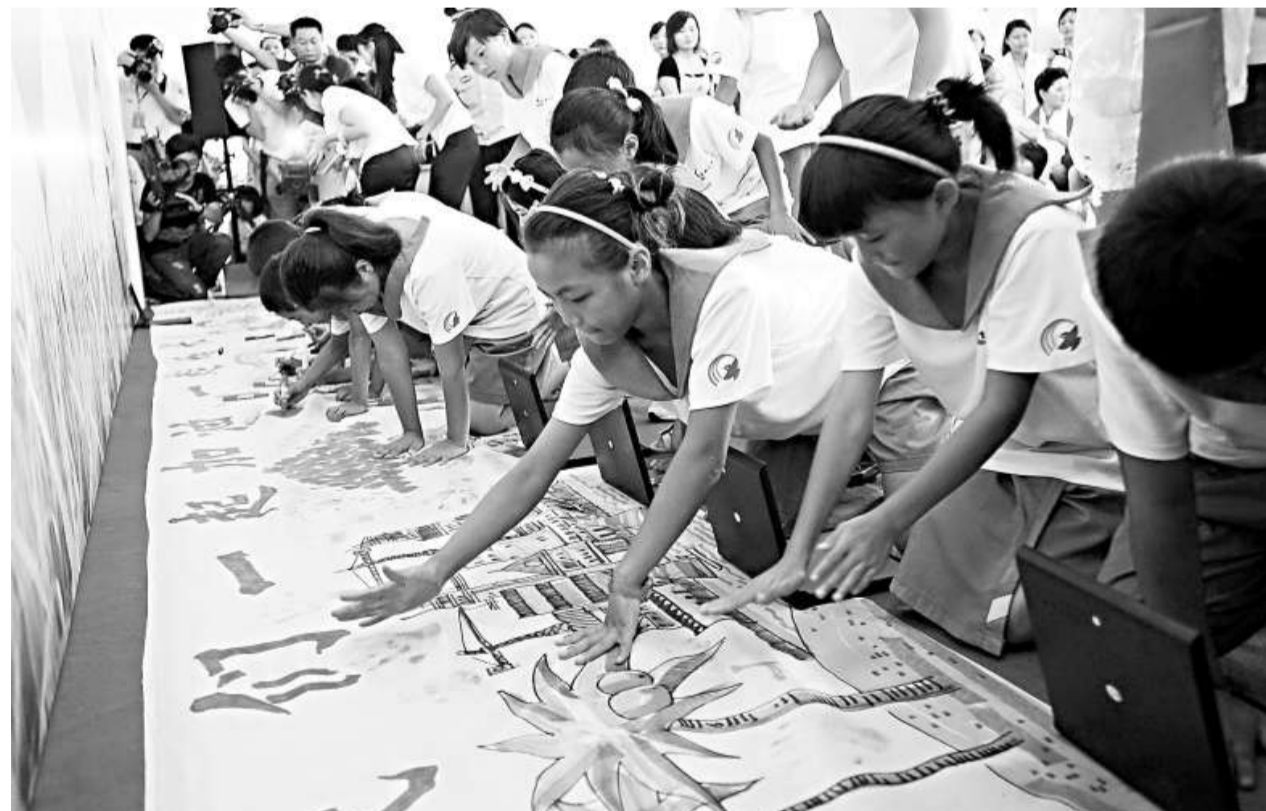
四川雙流縣新棠湖小學的學生二十六日除了捐款捐物，還在畫布上畫畫、寫字和按手印，向台灣災區小朋友送祝福

此外，災區屏東縣林邊、佳冬兩鄉本月八日被「莫拉克」豪雨淹沒以來，至今仍有上萬名軍人在加緊處理泥沙、積水。但台灣流行疫情指揮中心二十四日證實，當地救災士兵中四人確定感染甲型H1N1流感；此間各界憂心災區衛生條件差，疫情將擴大。