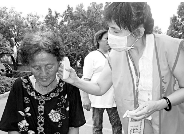
島內甲型流感疫情可能擴大，為防止災民收容中心發生群聚感染，高雄市天主教救世主堂二十六日起全面對災民量體溫 (中央社)

此外，風災過後，許多民眾開始懷念過去台灣「省長」宋楚瑜的時代，甚至認為應該找宋楚瑜回來當「行政院長」，至於是否重出江湖？宋楚瑜二十六日不願回應，倒是強調救災如同救命，希望馬政府立即做好災區衛生、水土生態與災民生計等三大建議。