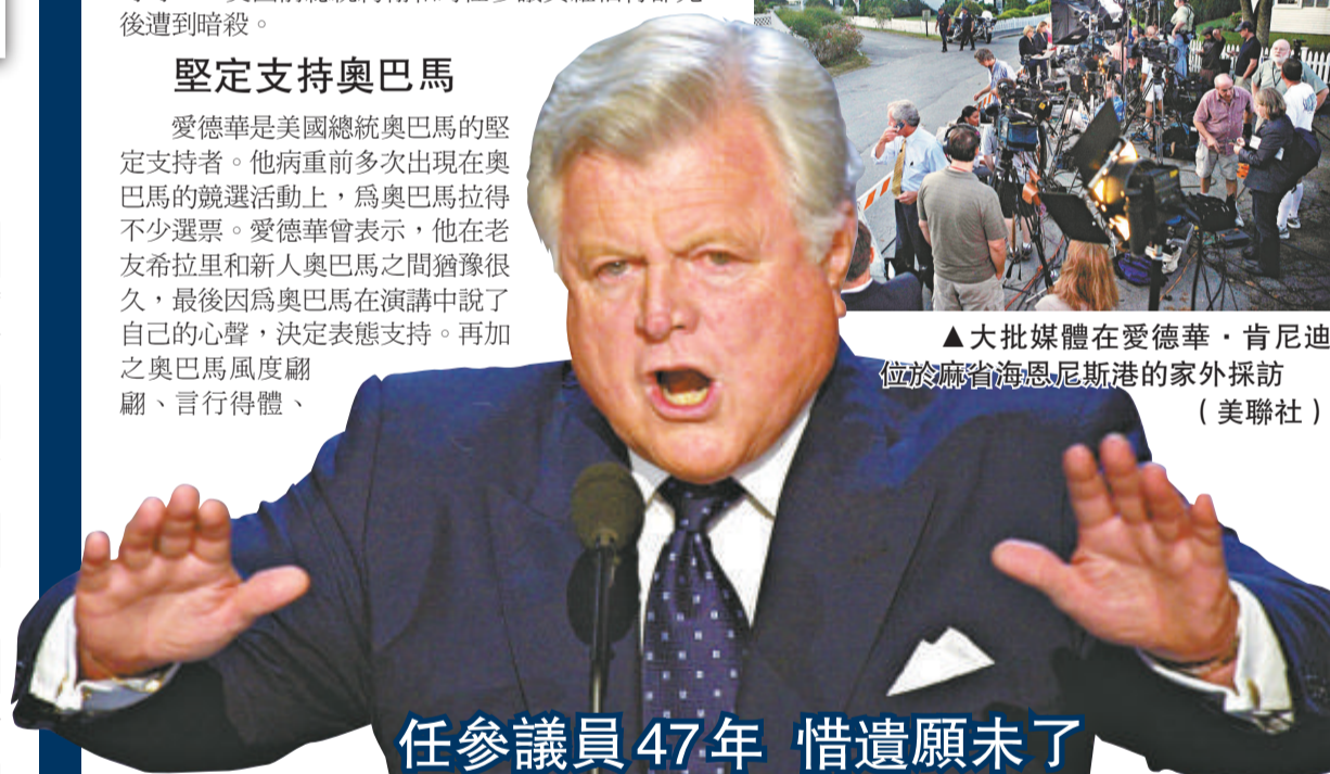
▲大批媒體在愛德華·肯尼迪位於麻省海恩尼斯港的家外採訪

愛德華是美國總統奧巴馬的堅定支持者。他病重前多次出現在奧巴馬的競選活動上，為奧巴馬拉得不少選票。愛德華曾表示，他在老友希拉里和新人奧巴馬之間猶豫很久，最後因為奧巴馬在演講中說了自己的心聲，決定表態支持。再加之奧巴馬風度翩翩、言行得體、