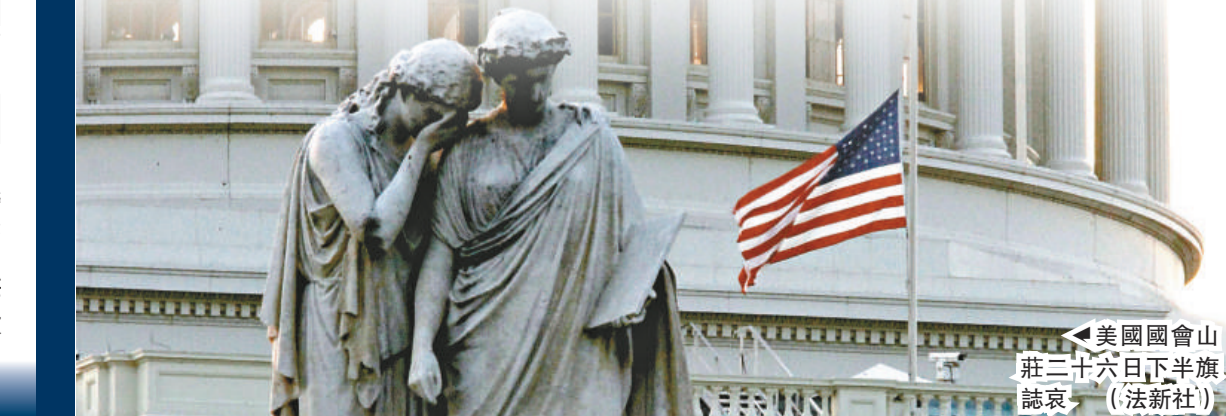
▲美國國會山莊二十六日下半旗誌哀 (法新社)

愛德華的辭世可能削弱民主黨在參議院的力量。《洛杉磯時報》記者西蒙曾說，很難想像參議院失去這頭「開明之獅」，會是什麼樣子。 克萊蒙特爾麥克納學院行政系教授柏亞尼則說：「具備愛德華·肯尼迪才幹的人在華盛頓越來越少。他一方面對黨忠心耿耿，堅持原則，跟對手周旋到底。另一方面，他能夠和另一黨合作，促成實事求是的妥協方案。他是跨越兩黨鴻溝的一道橋樑。少了他，等於少了橋樑。」 賓夕法尼亞大學政治學教授傑基兒說，這名「開明派元老」的離世，將改變民主黨的未來走向，使之出現右傾的可能。 (法新社)