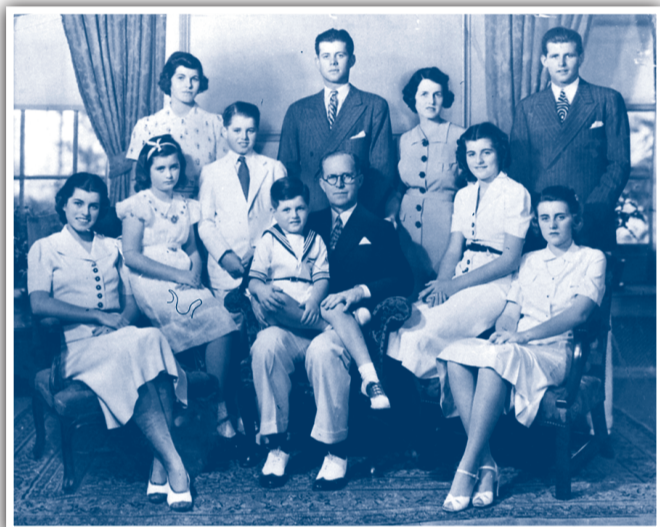
▲約瑟夫·肯尼迪夫婦與九子女合影，從左至右：(前排坐者)尤妮斯、簡、愛德華坐在其父腿上、帕特里夏、凱瑟琳；(後排站者)羅斯瑪麗、羅伯特、約翰、肯尼迪夫人以及小約瑟夫·肯尼迪

肯尼迪是在美國政壇舉足輕重的名門望族，但家族半世紀以來屢遭厄運，以致坊間一直有肯尼迪家族受詛咒的傳言。愛德華·肯尼迪如今雖因腦癌逝世，但他卻是四兄弟中唯一得享天年的。有坊間傳言指肯尼迪家族發迹後，處處得勢不饒人。據稱，有對手失敗後以刀自戕，每刺一刀都大聲詛咒肯尼迪後人「不得好死」。不過，也有人指出，「肯尼迪詛咒」只是幻象，他們家的成員天生愛冒險，遇險機率自然較大，加上肯尼迪名氣大，慘事都被廣泛報道。以下為肯尼迪家族成員的悲劇：