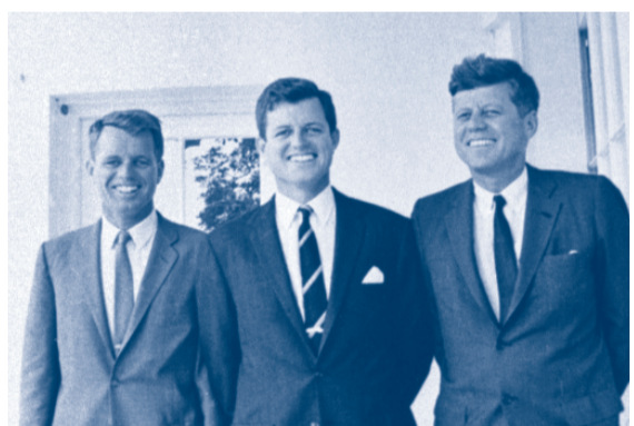
▲一門三傑：愛德華(中)與他的兩位兄長羅伯特(左)及約翰(右)

他說：「我們周圍有一系列新挑戰在等待我們，如果我們校準羅盤，就可以達到目標——不只是我黨的勝利，而是我國的復興。而今年十一月，火炬將再次傳給新一代美國人。有了奧巴馬，為你為我，我國將上下協力，支持他的事業。工作煥然一新，希望再次升起，夢想繼續生輝。」 他說：「有了奧巴馬，我們將拋棄誤解與扭曲的老式政治。有了奧巴馬，我們將拋棄種族對種族、性別對性別、族群對族群、非同性戀對同性戀的老式政治。」 (英國《每日電訊報》、美聯社)