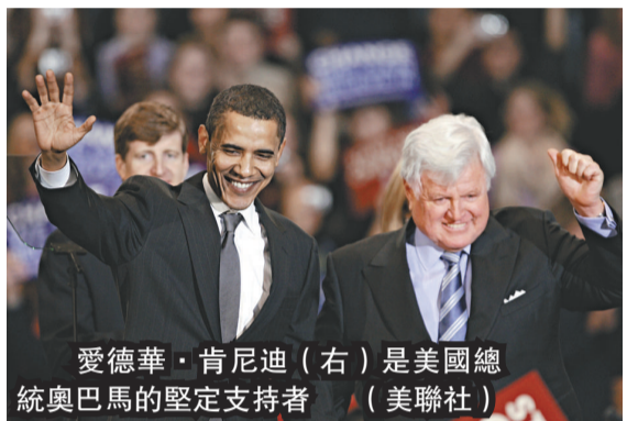
愛德華·肯尼迪(右)是美國總統奧巴馬的堅定支持者