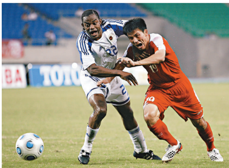
▲卓卓（左）今仗將繼續扼守港足後防