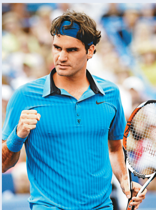
▲費達拿為美網男單頭號種子

俄羅斯名將舒拉賓復出後世界排名迅速提高，她從上週的第49位上升到本周的第30位，幸運地躋身種子行列第29位。 中國金花、世界排名分列19及22位的李娜及鄭潔，同樣躋身種子名單，李娜以第18種子身份參