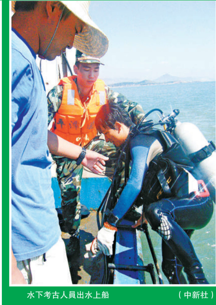
水下考古人員出水上船 (中新社)

據悉，第五期全國水下考古培訓也與此次水下文物普查同期舉辦，由國家博物館、福建博物院、福州市文物局以及部分其他省（市）的水下考古專業人員組成，主要是對國家水下考古隊員進行水下作業的培訓，有20名學員參加。趙嘉斌指出，此次培訓為中國水下考古事業的發展提供了新血和新的力量。