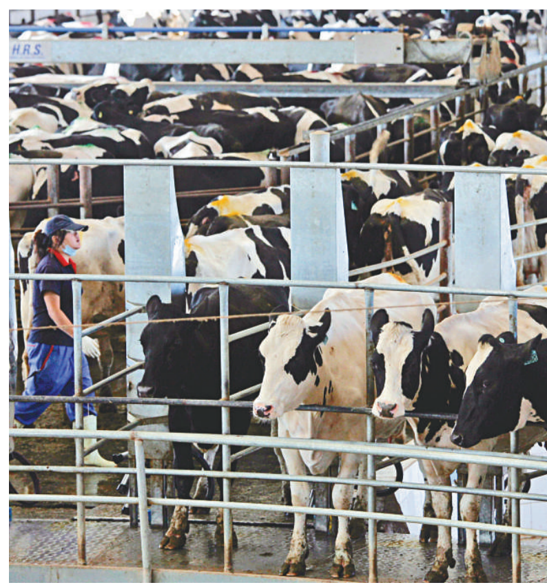
蒙牛牧場的現代化擠奶間

伊利、蒙牛多項世界第一的成績，成為乳都闖上世界乳業擂台的殺手鐮。湯愛軍表示，蒙牛在未來有可能進入「世界乳企」十強，而伊利也不甘落後。雖然目前還沒有「世界乳都」這個概念，但「中國乳都」呼和浩特成為世界乳業關注的城市，為期不遠。