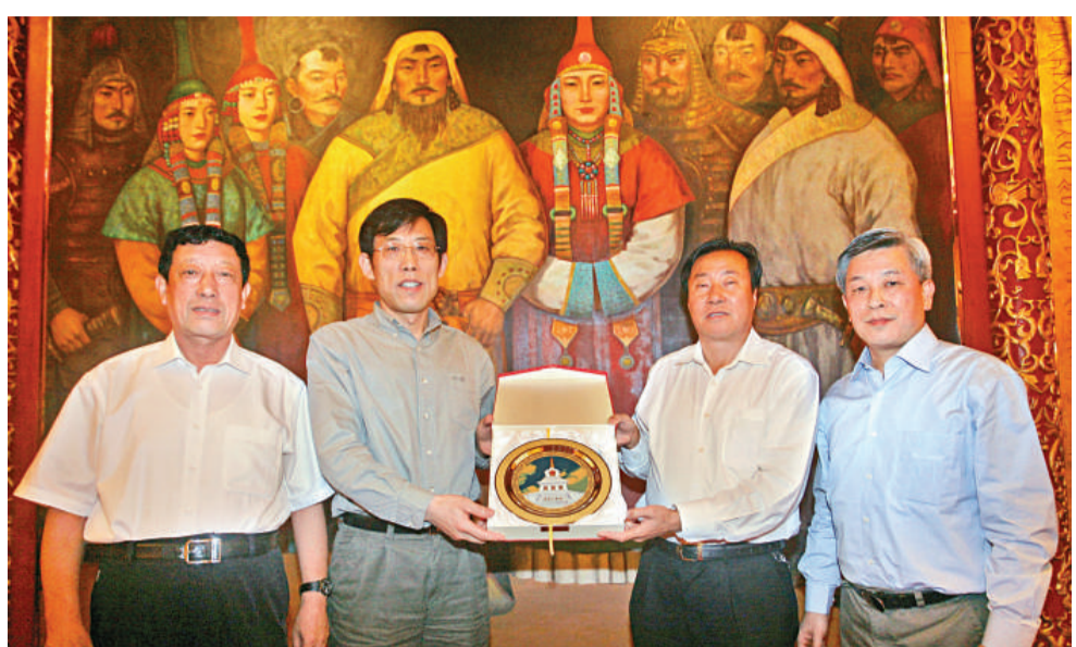
呼和浩特市市委書記韓志然(左三)、呼和浩特市市長湯愛軍(左一)、大公報董事長兼社長姜在忠(左二)、大公報副總編輯李啓文合影留念