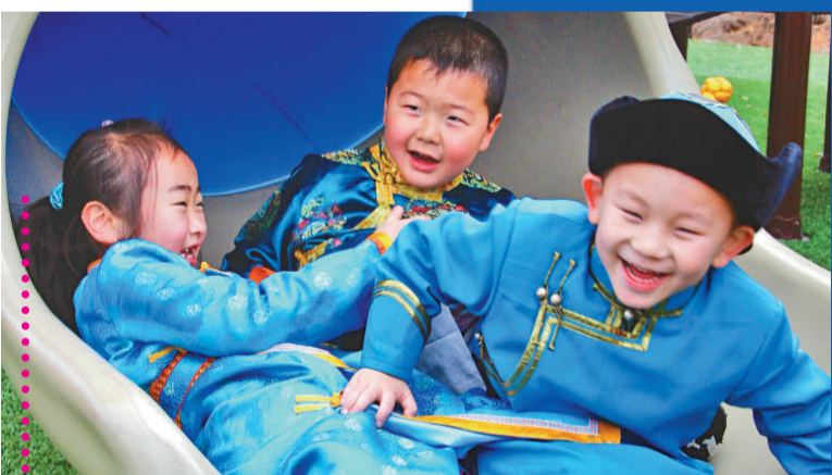
呼和浩特市蒙古族幼兒園的孩子們在玩耍