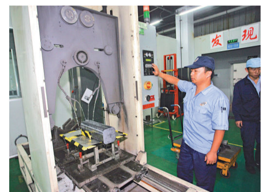
晟納吉光伏材料有限公司生產車間

談到呼和浩特與香港的經濟合作，湯愛軍特別對大公報記者強調說，雖然地處北疆，呼和浩特與香港距離遙遠，但是兩地經濟合作非常密切。例如香港嘉里集團參股呼和浩特水務公司股份