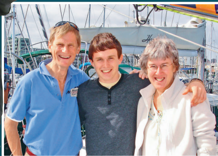
佩勒姆(中)與父母合照