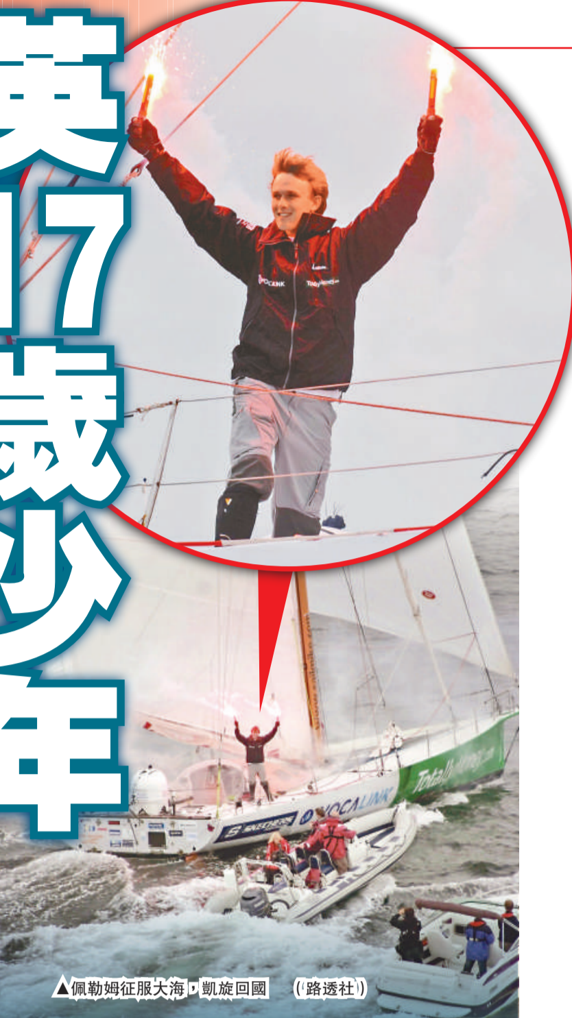
佩勒姆征服大海，凱旋回國