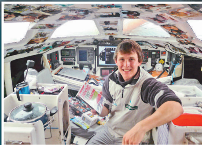
佩勒姆的賽艇內窺