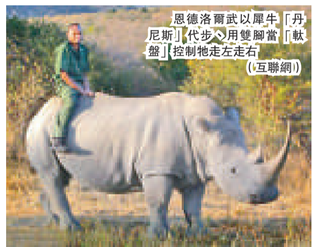
恩德洛爾武以犀牛「丹尼斯」代步，用雙腳當「軀盤」控制牠走走左右

范海爾德說：「由於這塊石頭來自首相的收藏，因此沒有人想到要用懷疑的眼光看待它。」但來自荷蘭阿姆斯特丹自由大學的研究員也說，他們一看就看出那塊石頭有可能並非來自月球。他們在初步評價後再進行大規模測試。結果，地質學家伯恩克在館方發表的一篇文章中總結道：「它是一塊單調、沒什麼價值的石頭。」雖然館方一度替它投保五十萬美元，但伯恩克稱它的價值低於七十美元。(美聯社)