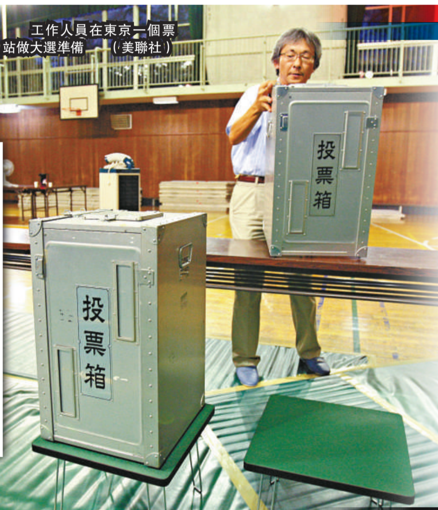
工作人員在東京一個票站做大選準備