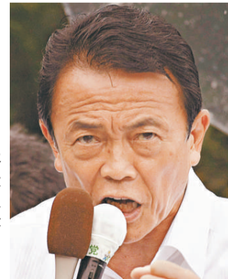
▶ 日本首相麻生太郎雖大勢已去，但仍努力拉票

飯尾指出，其實很多選民並不是真正支持民主黨，而是因為想讓自民黨下台才決定投民主黨的票。民主黨上台後將怎麼做現在還並不明確，但選民已厭倦了自民黨長期以來通過與職業官僚機構結合來推行政策的方式。他們中的許多人首先希望的是發生變化，然後才考慮下面的事情。選擇自民黨不會帶來變化，除了支持民主黨他們別無選擇。