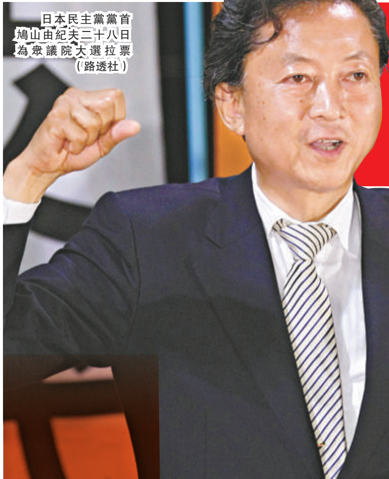
日本民主黨黨首 鳩山由紀夫二十八日 為眾議院大選拉票