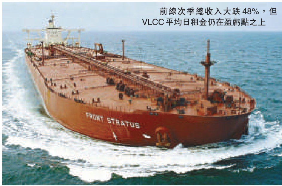
前線次季總收入大跌48%，但VLCC平均日租金仍在盈虧點之上

比率分別為40%和27%，加上額外融資和減少船隊擴充規模，可望大大降低營運風險。該公司在次季再接收一艘VLCC新船，不過已與兩家船廠達成協議，取消建造4艘蘇伊士型油輪和2艘VLCC，有關訂單總值5.5億美元，相當於旗下積存訂單總額的