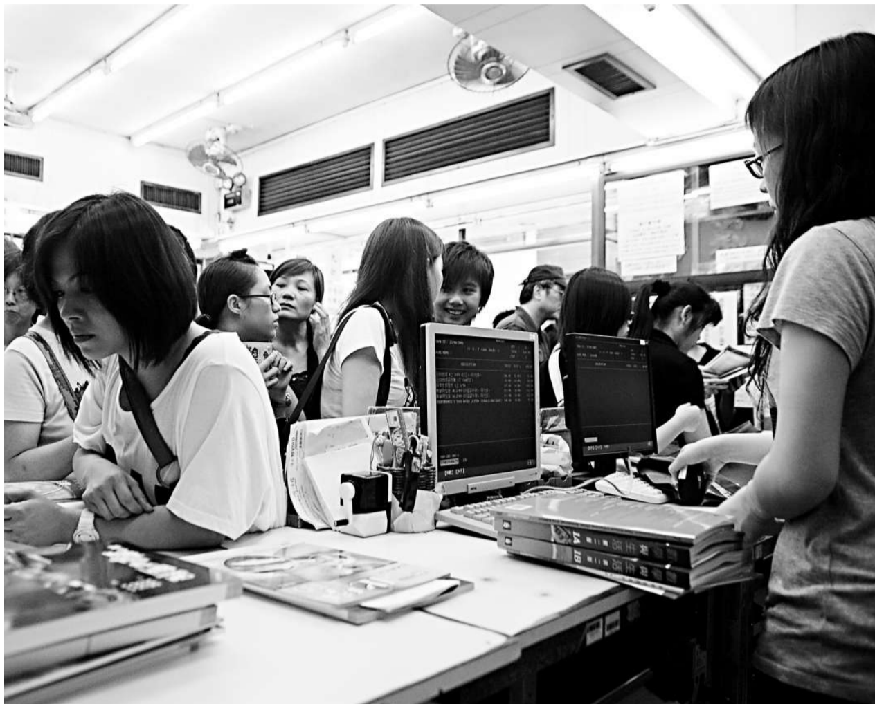
消息稱，教育局擬要求課本出版商「按需要改版」，取代三年不改版

紙價升、學制變等種種因素令教科書價格持續高企，大批家長叫苦連天。有見及此，教育局去年成立由書商、學界、政府官員等組成的專責小組去尋求對策，例如考慮推行電子教科書及分拆教材等，經大半年研究可望於九月間提交報告。