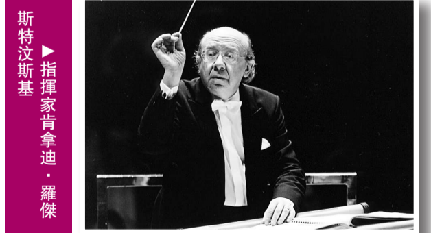
▶指揮家肯拿迪·羅傑斯特沃斯基

音樂會、《費德里奧》歌劇音樂會及「貝九」音樂會。除迪華特的自家炮製外，「港樂」推出的專場計有十月的羅傑斯特沃斯基父子檔，父親指揮、兒子演奏貝多芬小提琴協奏曲，明年一月夏定忠指揮陳薩的舒伯特專場及呂嘉與狄里柏斯基的拉赫曼尼諾夫專場、三月夏定忠領導的舒伯特另一專場、六月托利爾與伊沙利斯同心齊獻的「法國之夜」，以及湯沐海與王羽佳的「蘇俄之夜」。當然，上文提及五月的「歌舒詠專場」則屬於一項特別的呈獻。樂季的壓軸音樂會是余隆領導的奧爾夫《布蘭詩歌》。此外，樂團將會先後在明年一月及二月舉辦陳薩與李雲迪鋼琴獨奏會，亦值得注意。