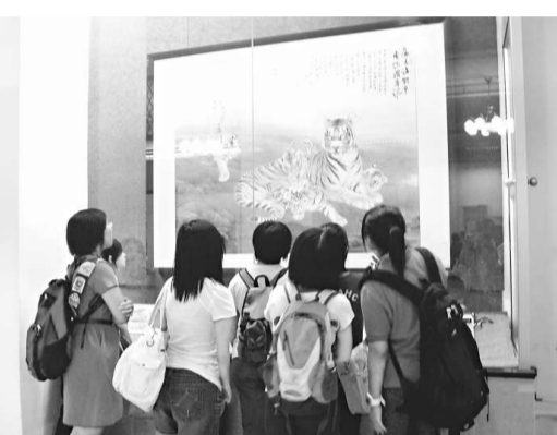
▲一群青少年聚精會神地觀賞董希源的畫作

除了為人民大會堂、天安門城樓中央大廳創作並贈送了《錦繡河山美如畫》等數十幅畫作之外，董希源表示，他亦多次應中央及省的有關部門邀請，創作國禮畫，這些作品走出了國門，為豐富大眾的文化生活，提升