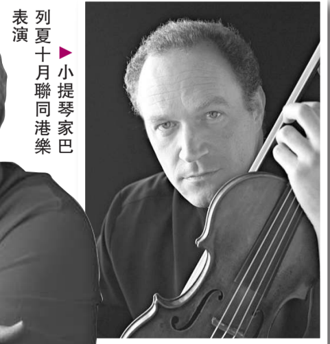
表夏十月聯同港樂演奏小提琴家巴