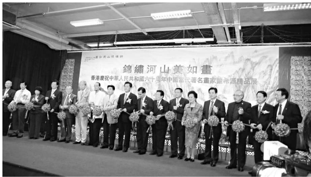
▲嘉賓們為展覽開幕禮剪綵

高敬德致辭時介紹說，這是董希源首次來港舉辦畫展，與港人共慶祖國六十華誕。董希源是北京天安門城樓和人民大會堂特邀作畫的年輕畫家，作品《錦繡河山美如畫