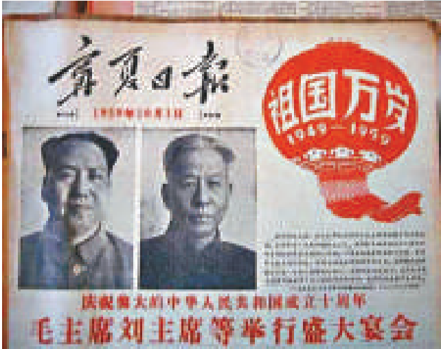
●報紙關於國慶的報導 ●《中學生》雜誌慶祝國慶專輯