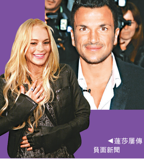
◀ 蓮莎屢傳 負面新聞