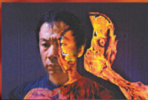
◆《鐵男，子彈人》代表日本出征