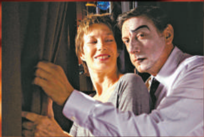
◆《36 Vues Du Pic Saint Loup》講述馬戲團的故事

兩齣競賽的華語電影包括由鄭保瑞導演的《意外》，以及楊凡導演的《淚王子》。前者的故事是利用連串「意外」的手段來造成暗殺效果，影像上有着非常強烈「銀河影像」的風格，相信隨着杜琪峯近年在威尼斯的影響力（去年他曾擔任評審），電影會受到一定的重視。有「唯美導演」之稱的楊凡，一向對藝術有着完美的追求，他在《淚王子》中觸及上世紀五十年代由內地遷往台灣的國民黨黨員及其家屬生活在眷村的歷史，交代出一個跨越兩代間的悲歡離合的故事。