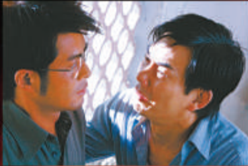
◆鄭保瑞的《意外》可會為港爭光？