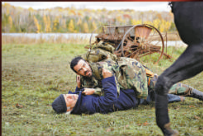
◆《Survival of the Dead》驚慄嚇人