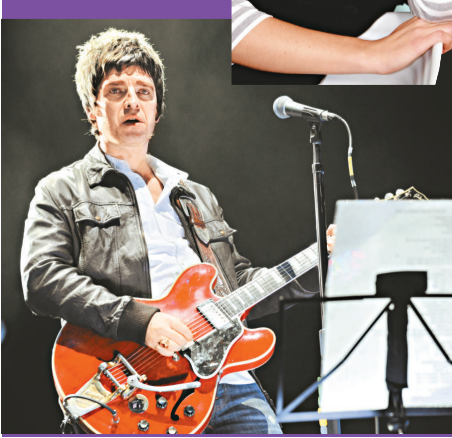
▼ Noel 對「粉絲」感到抱歉