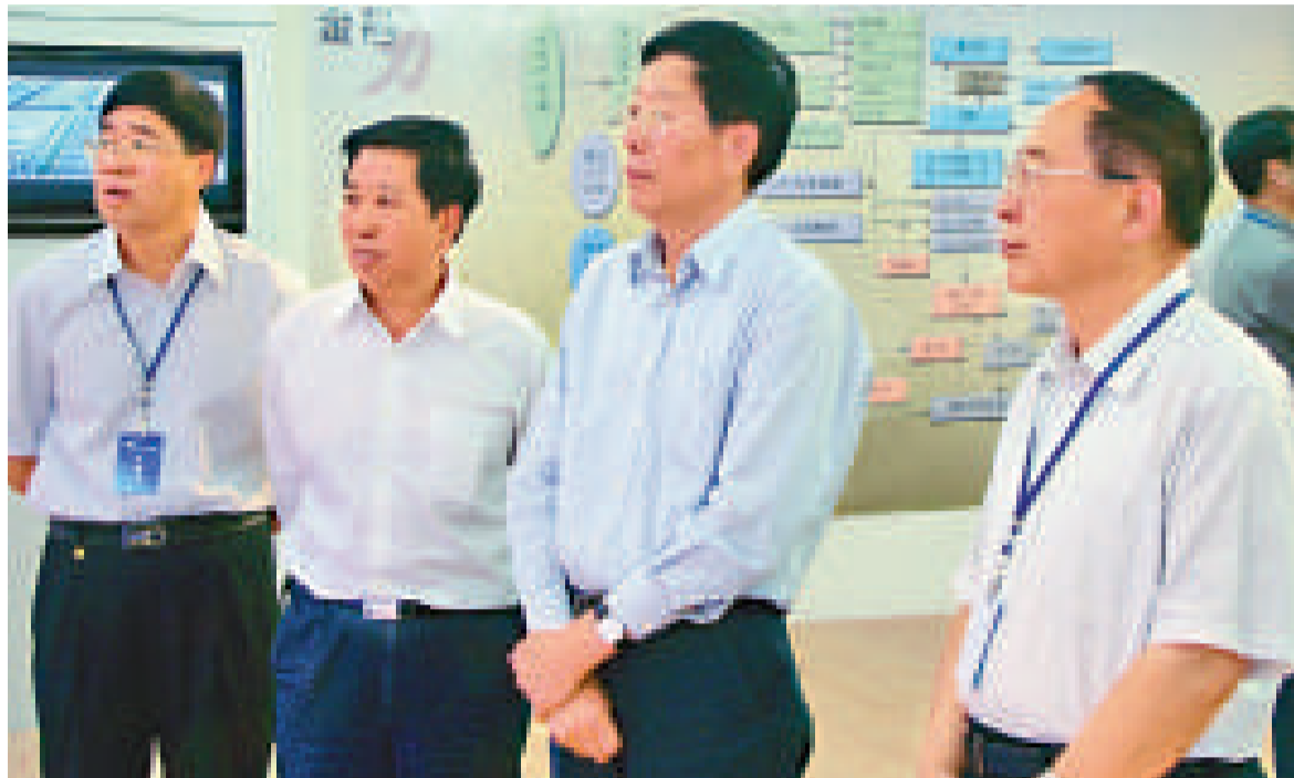
甘肅省省長徐守盛（右二）在金昌市了解循環經濟規劃建設情況