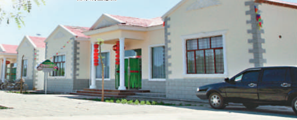
▼金昌市新農村建設示範點——陳家溝生態園

金昌市市長張令平表示，在具體工作中，金昌市按照基礎設施配套化、增收機制多元化、公共服務一體化、發展理念生態化、基層民主制度化「五化」的思路，以金川區為先行，有步驟、分層次地推進城鄉一體化發展，已呈現出城鄉互動融合，市區、重點鎮和中心村聯動發展的良好格局。目前，已建成國家級啤酒大麥標準化生產示範區，啤酒麥芽產量佔全國自產量的15%以上，食用菌產量佔全省的50%；91%的行政村通上柏油路或水泥路，農村自來水入戶率達到50%，高標準農宅佔全市農戶總數的六分之一，廣播電視實現「村村通」，電信寬帶行政村覆蓋率達91.3%，使用清潔能源的農戶達20%，80%的行政村建