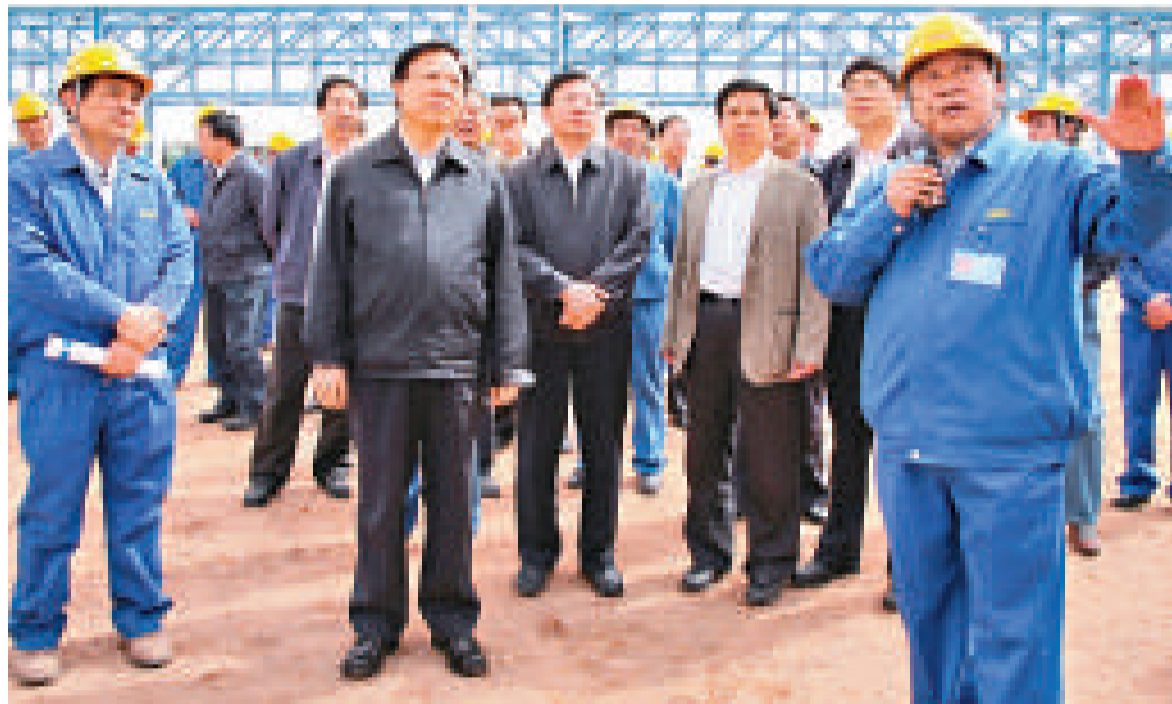
甘肅省委書記陸浩（左二）等在金昌市專題調研

金昌市建於1981年，總面積9600平方公里，地處河西走廊東段，祁連山北麓，北鄰內蒙，南接青海，轄永昌縣、金川區一縣一區，總人口47.29萬，其中城鎮人口12萬。