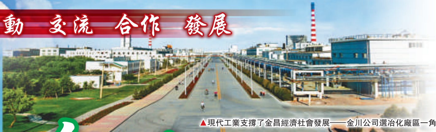
▲現代工業支撐了金昌經濟社會發展——金川公司選冶化廠區一角